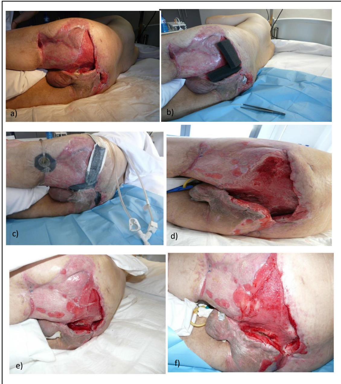
Figura 2: evolución de una herida por traumatismo pélvico con pérdida de sustancia utilizando el sistema VAC a) al ingreso, b) primera cura, c) conexión sistema VAC, d) 12 días post-terapia, e) 23 días post-terapia y f) 1 mes post-terapia 35 .