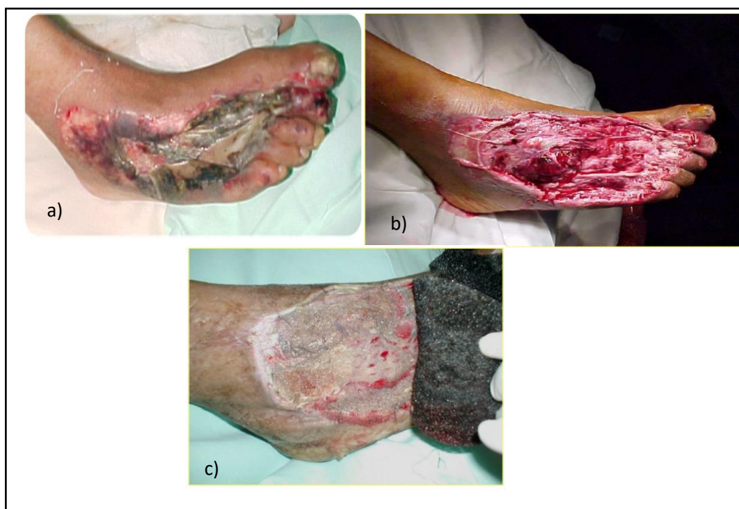
Figura 3: evolución de una herida por aplastamiento utilizando sistema VAC a) al ingreso, b) desbridamiento previo a la terapia y c) 2ª cura 4º día post-terapia 35 .

En la Figura 3, queda reflejada la evolución de una herida por aplastamiento a la que se le realiza un desbridamiento correcto.