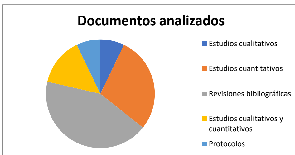
Gráfico 2. Metodología de los artículos analizados. Elaboración propia

De los 14 documentos analizados, 12 son realizados en España (3,4,18,19,5–7,10–14) y los otros dos han sido realizados en Estados Unidos (8,9). En cuanto a la metodología de los trabajos, como puede verse en el gráfico 2, la mayoría son revisiones bibliográficas.