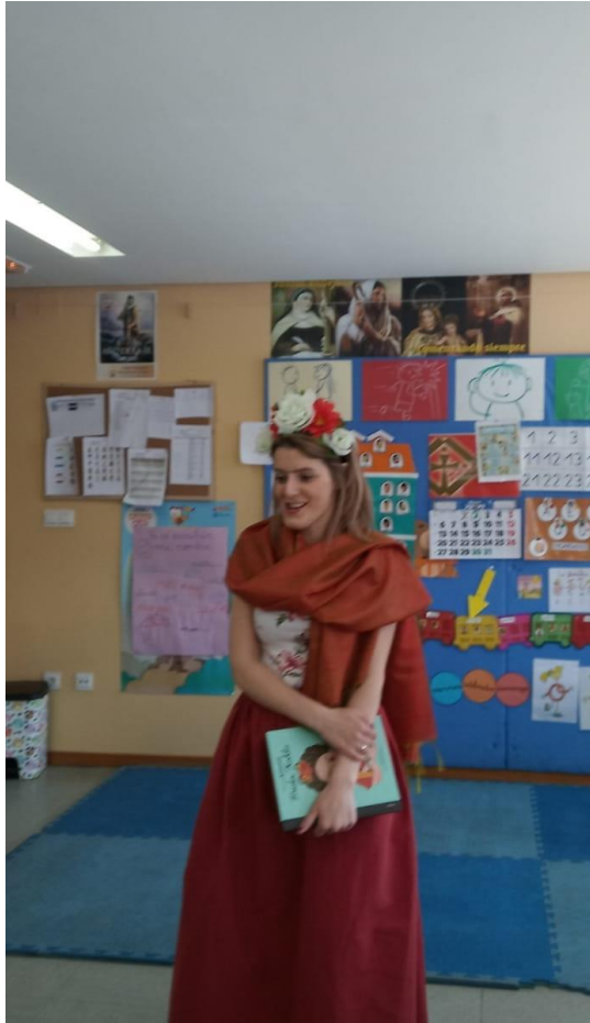
Actividad 3: Soy Frida Kahlo.