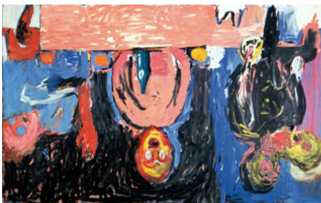
Figura 5. Cena en Dresde (1983). Georg Baselitz. Captura de la Web:

Basada en la pintura al revés de Georg Baselitz