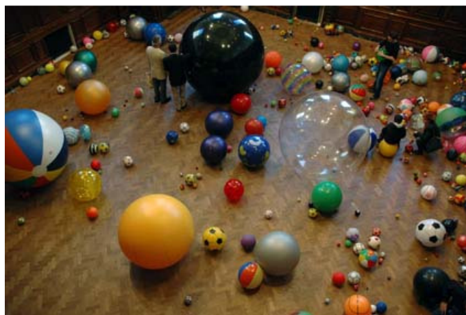
Figura 4. Work No. 370 Balls (2004). Martin Creed.

Basada en la instalación de Martin Creed.