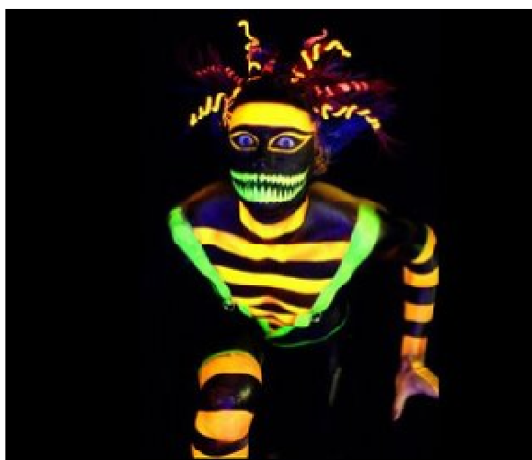
Figura 2. Black light. Obra de Body Art de Youri Messen-Jaschin. Captura de la Web:

Basada en Body Art de Youri Messen-Jaschin.