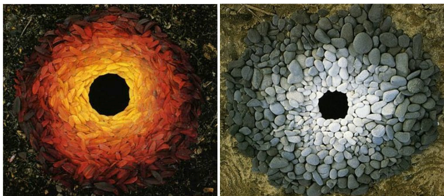
Figura 3. Rowan leaves and pebbles around a hole (1987). Andy Goldsworthy.