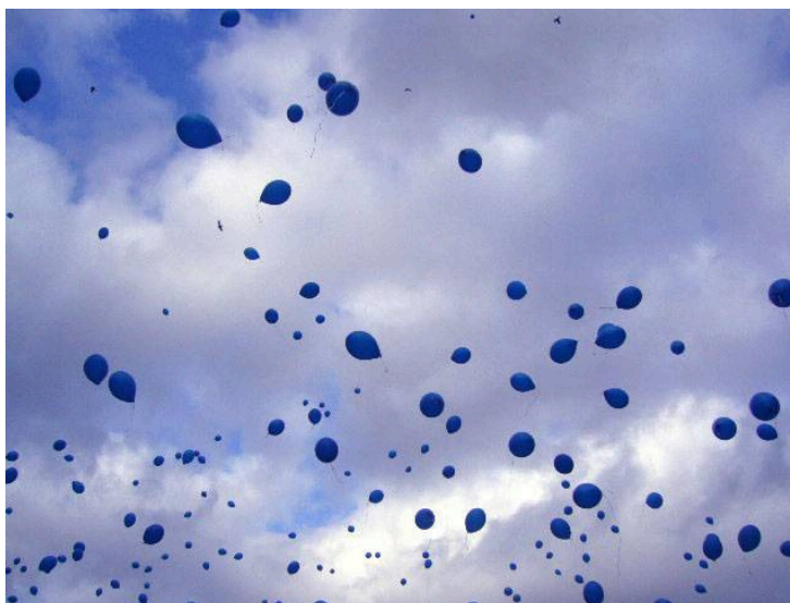
Figura 6. Escultura Aerostática (1957). Yves Klein.