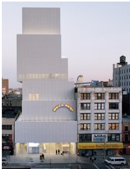
Figura 1. New Museum de Nueva York (2007). Captura de la Web:

Basada en el edificio New Museum de Nueva York.