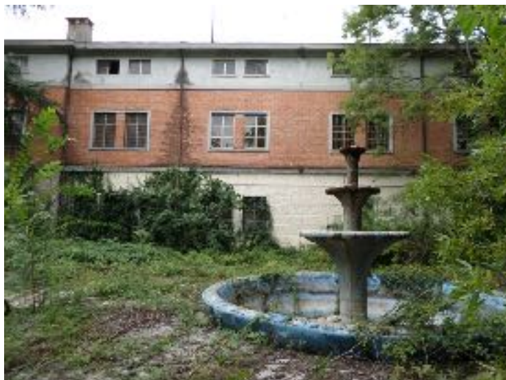
Figura 1 | Degrado e abbandono all'interno della caserma Trieste di Casarsa della Delizia.

Gli immobili militari costituiscono un patrimonio vasto, articolato e disperso territorialmente, spesso abbandonato o sottoutilizzato, le cui strutture, ancorché in uso attivo alle Forze Armate, talvolta sono caratterizzate da obsolescenza, scarsa integrazione nel territorio, degrado e potenziali passività ambientali. I comprensori militari, così come le aree industriali, sono insediamenti che hanno influenzato il disegno territoriale, stabilendo o precludendo relazioni fra parti di territorio (urbano o rurale) visibili anche dopo la loro dismissione. La mancanza di manutenzione e gli inevitabili atti di vandalismo possono portare ad un serio livello di degrado (figura 1).