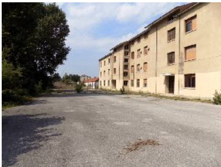
Figura 4 | Vista dell'ex-area militare (2015), a destra i dormitori per la truppa.