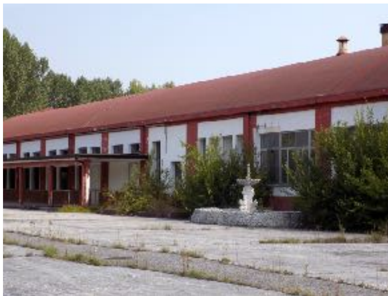
Figura 3 | Casarsa, ex-caserma Trieste, vista dell'esterno dell'edificio mensa truppa.

La caserma Trieste e l'aeroporto Francesco Baracca sorgono dopo la fine della Seconda Guerra Mondiale su parte del campo di aviazione dei dirigibili realizzato a Casarsa durante la Prima Guerra Mondiale. Quattro decenni di utilizzo militare hanno segnato profondamente il territorio casarsese 12 e il sottoutilizzo della caserma (235.000 mq di superficie) è cominciato nell'aprile 1991, quando il 'Reggimento Cavalleggeri Guide' è stato trasferito a Salerno. Successivamente nella struttura si è insediato il '41° Reggimento di artiglieria Cordenons'. L'uso della Trieste sembrava confermato da importanti lavori di riqualificazione avviati nel 1994, ma con la fine del servizio di leva nel 2001 è cominciato un progressivo ed inesorabile abbandono del comprensorio militare, pur al contempo prevedendo la conservazione del contiguo aeroporto militare (Senato della Repubblica, 2003). Il trasferimento del '41° Reggimento di artiglieria Cordenons' a Sora (Frosinone) è avvenuto nel 2007 (Senato della Repubblica, 2007).