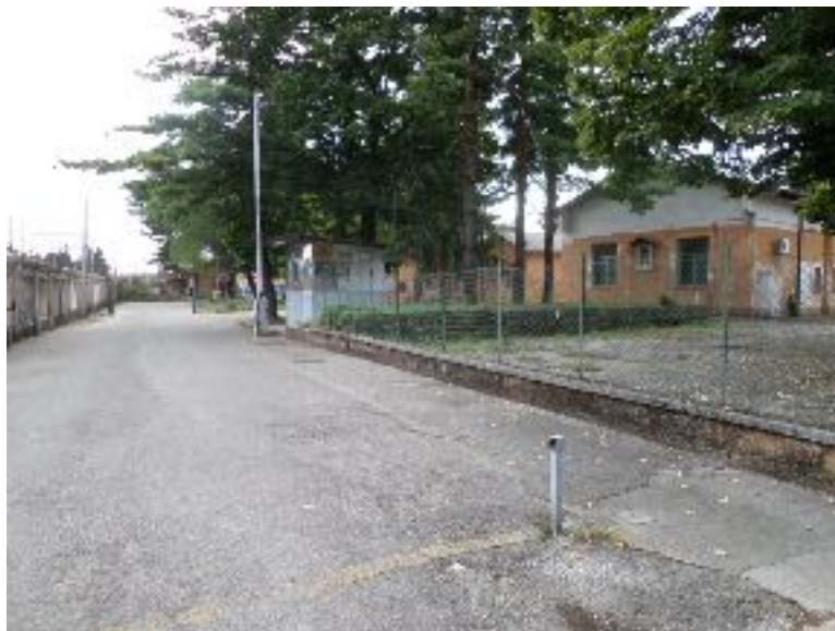
Figura 2 | Entrata dell'ex caserma Cavarzerani di Udine nel 2015, che dal 2016 è diventata temporaneamente centro di accoglienza per migranti.

La terza operazione riguarda l'applicazione dell'articolo 26 del Decreto 'Sblocca Italia', grazie al quale sono stati individuati, tra 2014 e 2015, 14 immobili ex militari sul territorio italiano, tra cui due ubicati nel comune di Udine. Si tratta delle ex caserme Cavarzerani e Friuli (figura 2) le cui superfici si attestano rispettivamente a 156.046 mq e 10.505 mq. In entrambi i casi ogni prospettiva di riqualificazione è stata bloccata. Dapprima, dall'inserimento dell'ex comprensorio militare Cavarzerani nel Piano Accoglienza 2016 del Ministero dell'Interno quale centro di accoglienza per profughi; in seguito, a fronte della continuità dell'emergenza, anche nel caso della caserma Friuli è stata disposta la stessa destinazione d'uso 10 .