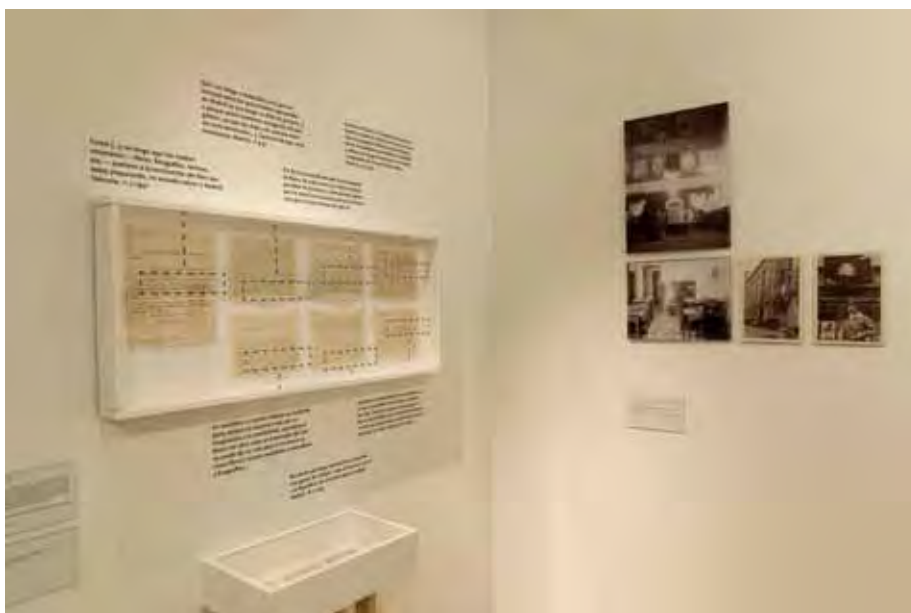
Figura 6. Detalle de la exposición.