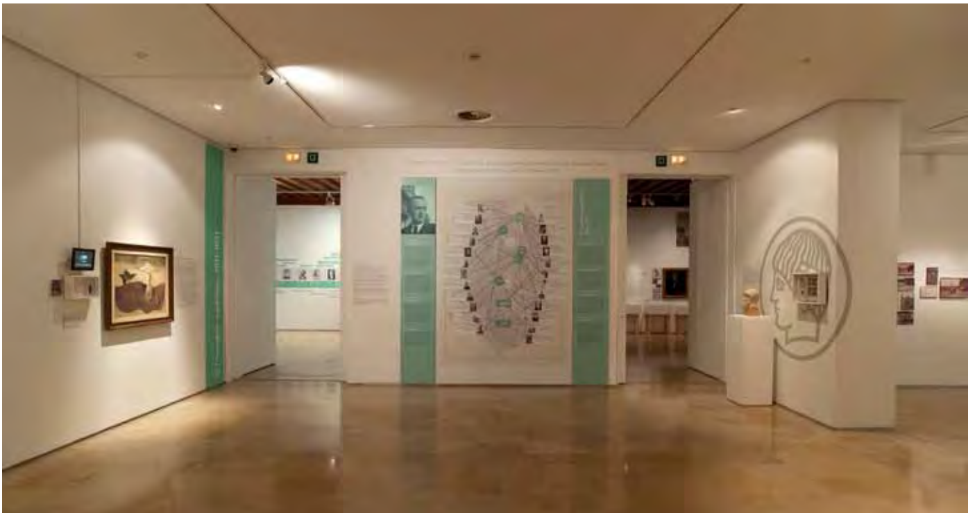
Figura 3. Sala segunda.

En los veinte años que transcurren entre su llegada a Madrid y la proclamación de la República, Orueta se dedica, en cuerpo y alma, al estudio y conocimiento de la escultura española. Este aspecto de su biografía se pone de relieve en la presentación de obras de los escultores del Renacimiento y del Barroco español, de las cuales hay un importante