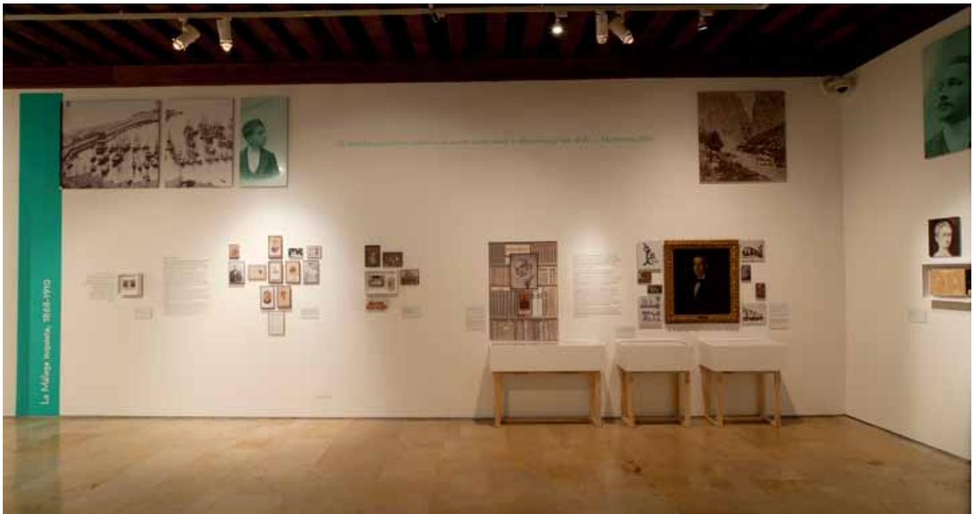
Figura 2. Sala primera.