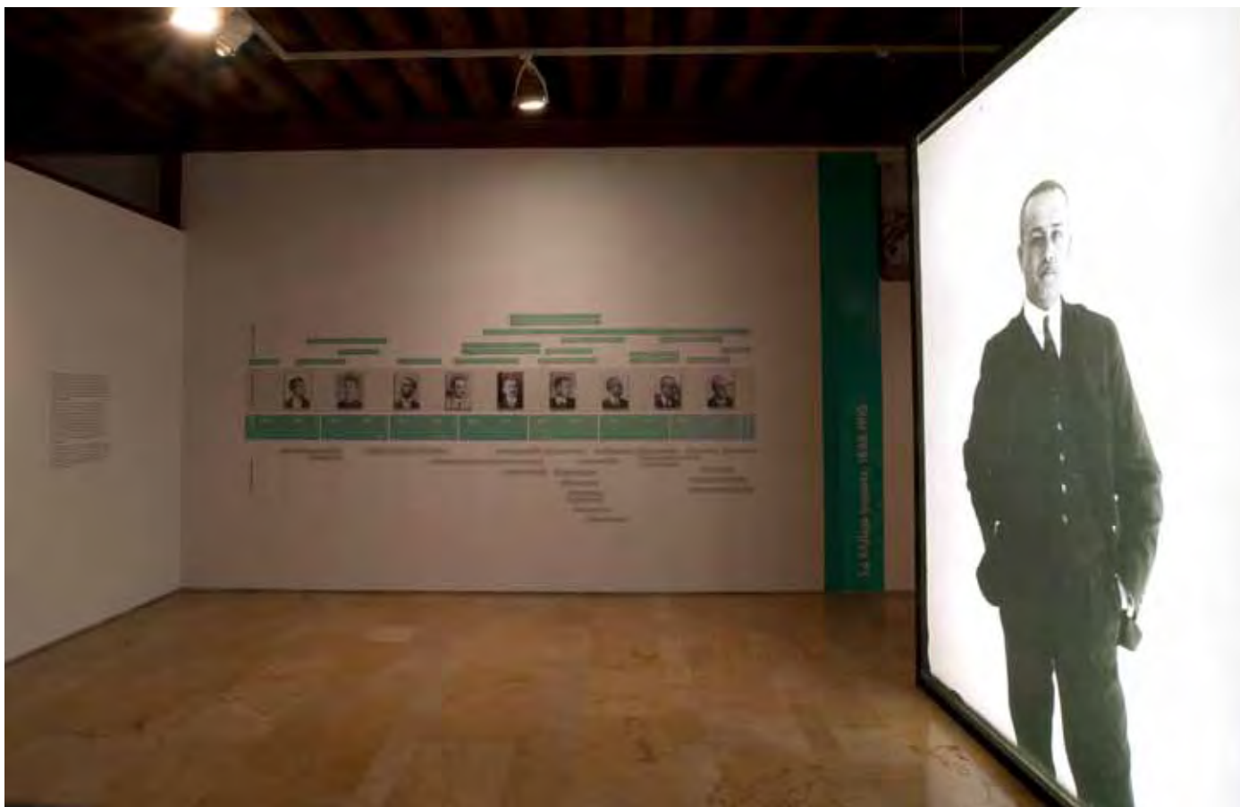
Figura 1. Entrada a la exposición.

tan significativos en esas décadas como la vanguardia intelectual malagueña (una de las ciudades más dinámicas e innovadoras del panorama nacional), la Institución Libre de Enseñanza, la Residencia de Estudiantes, el Centro de Estudios Históricos, la Academia de San Fernando. Descubrió a los grandes escultores españoles del Siglo de Oro; desplegó un comprometido activismo contra el expolio patrimonial que padecía el país en las primeras décadas del siglo, y finalmente, desde el primer día de su nombramiento como Director General de Bellas Artes en la II República (en los gobiernos de 1931-1933 y 1936), fue el definidor de los aspectos culturales de la Constitución del 31, puso en pie toda una política de salvaguarda y difusión pública del tesoro artístico español, de sus monumentos, su arte y sus museos, y culminó en la promulgación de la Ley del Tesoro Artístico de 1933, una de las más avanzadas de Europa.