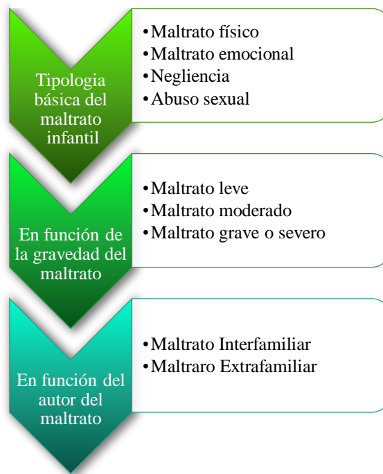
Figura 2. Clasificaciones del maltrato infantil