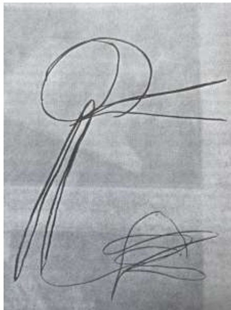
Dibujo de un niño de cuatro años: “Mamá sale de compras”.

Garabato con nombre: (3-4 años). Es una etapa de mucha trascendencia en el desarrollo del Niño. Es cuando el trazo adquiere valor de signo y de símbolo. El Niño ya no dibuja por simple placer motor, sino con una intención; aunque el garabato no sufra en sí demasiadas modificaciones, el Niño espontáneamente le pondrá un nombre. El mismo trazo o signo puede servirle para representar distintas cosas y también es posible que cambie en el transcurso de su tarea el nombre de lo que ha dibujado.