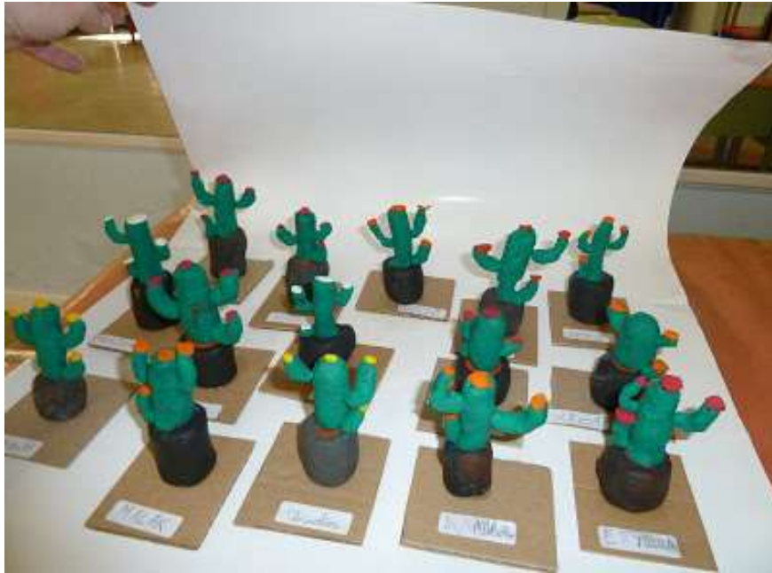
Sesión 2: Los Niños crean los cactus con la pasta de sal y los palillos de forma libre.