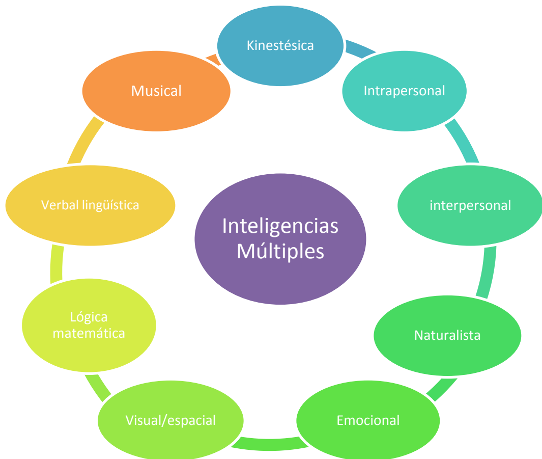
Figura 1: Modelo representativo de las nueve inteligencias basado en la teoría sobre las inteligencias múltiples de Howard Gardner.

Dentro de estas nueve inteligencias de Gardner, me centro en desarrollar las que están más relacionadas con la propuesta de intervención diseñada, con el recurso sobre el que se desarrolla la propuesta, las canciones.