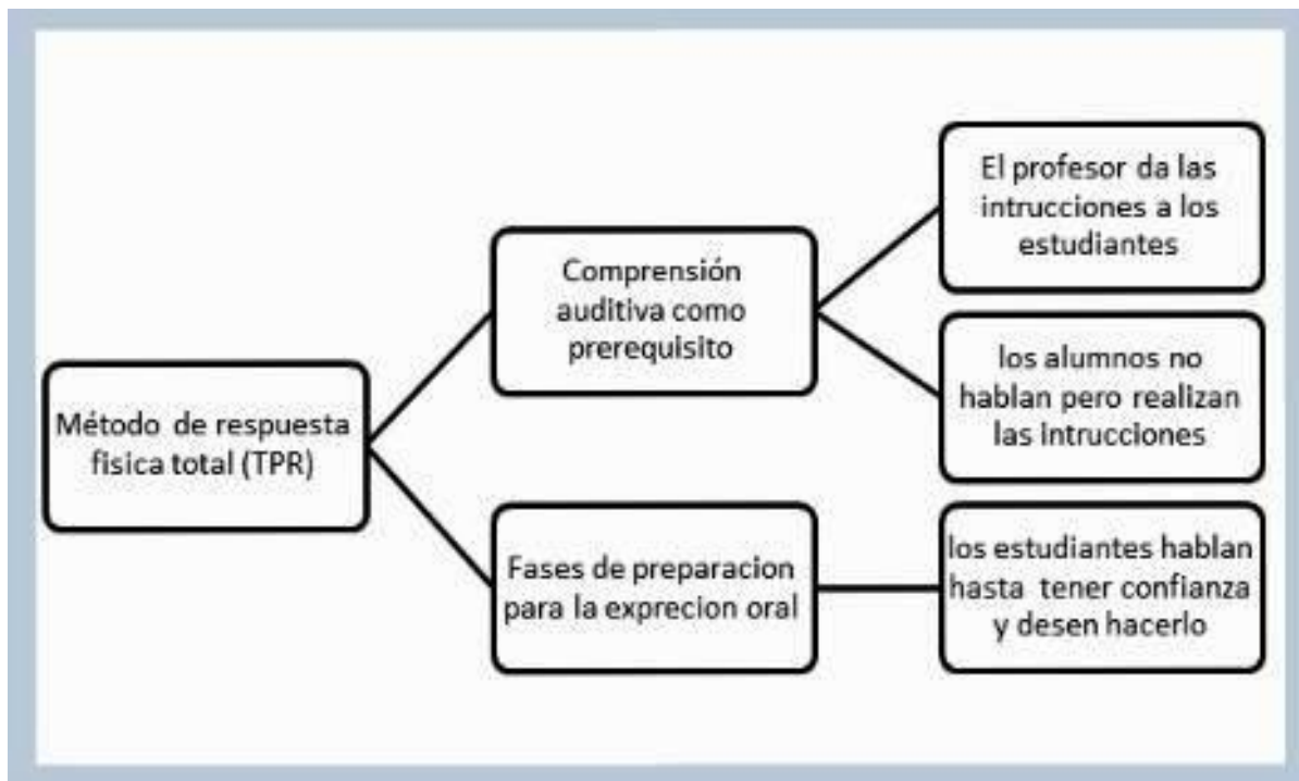
Figura 2: Esquema –resumen del proceso que sigue el alumnado al utilizar la metodología T.P.R. según los estudios de J. Asher (2009)