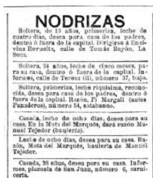
Figura 2: “Nodrizas”, Hemeroteca digital “El Norte de Castilla”, 18/06/1914, p 4.

El oficio de nodriza, o ama de cría, es una de las primeras ocupaciones que ha desarrollado la mujer y que ha perdurado a lo largo de la historia 26 27 . Entre las nodrizas se podían encontrar condiciones diferentes: las nodrizas de auxilio que alimentaban, casi siempre altruistamente, niños que no podían ser amamantados por su madre por falta de leche, fallecimiento o abandono, y las nodrizas mercenarias.