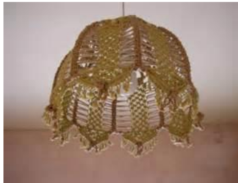
Ilustración 4: lámpara de macramé

Recuerdo con gusto estas clases, en las que, de alguna manera, se nos hacía partícipes de ese conocimiento, hacíamos algo que se podía poner en algún sitio, veíamos como de una madeja de macramé