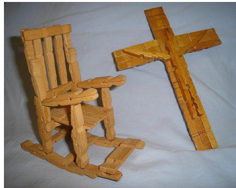
Ilustración 2 trabajo de pinzas

Algunos viernes la sesión de tarde de 15h. -17h. la dedicábamos a manualidades, unas veces llevábamos pinzas de madera y pasábamos media tarde separándolas, quitándoles el metal, que unía las dos mitades, otra tarde terminábamos de pegarlas y por último solo nos queda pintarlas, barnizarlas.