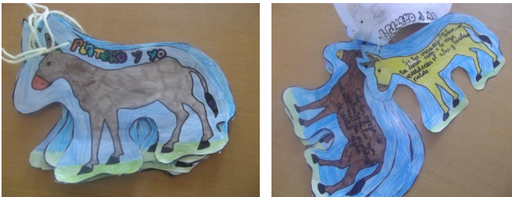
Ilustración 6: Cuentos y relatos de Platero.

Una vez que la comunidad escolar, ya conocía a Platero, se pidió, que lo dibujasen y que escribiesen sobre él. De este modo, los dibujos servirían para marcar el