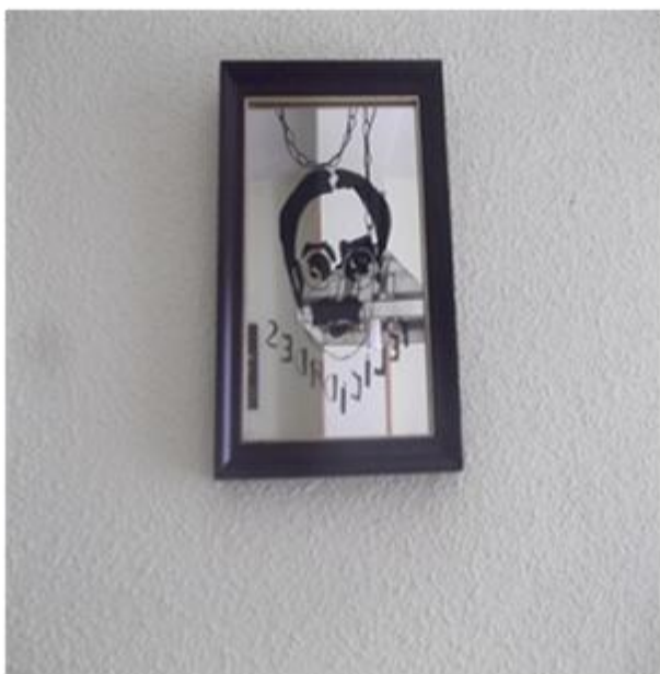
Ilustración 3. Cuadro que hice para el día del padre.

En esta etapa sí tuve plástica, los contenidos, dependían de los conocimientos de la persona que lo impartiera y sus ganas de hacer, teníamos profesores que nos hacían