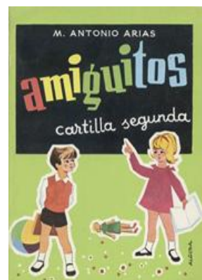
Ilustración 1parvulito y cartilla de lectura