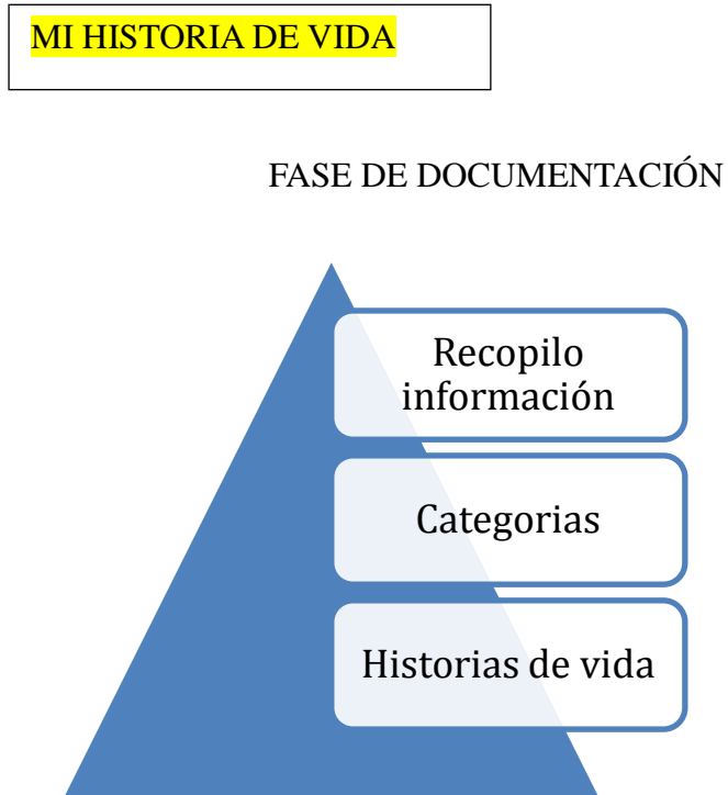
Gráfico 1 Fase de la documentación en una historia de vida

Intento descubrir las ideas, valores que he recibido a lo largo de mi etapa como discente y comprobar su reflejo en mi práctica docente.