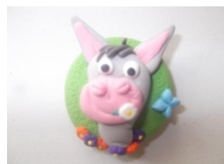
Imagen 7. Imán de Platero.

Por su parte, los alumnos de 4º , con ayuda de una Monitora de la franquicia de arcilla polimérica de