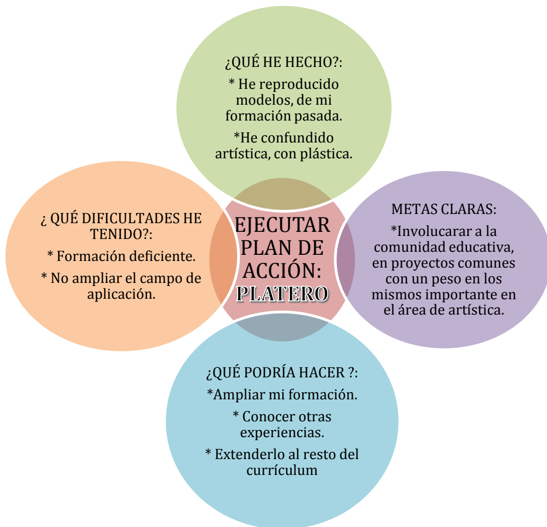
Gráfico 3 ¿Qué ayuda a la creación del proyecto Platero?

Este repaso sobre mi propia trayectoria profesional y como discente, me ha facilitado un punto de vista diferente de situaciones pasadas y como estas tienen repercusiones en mi presente.