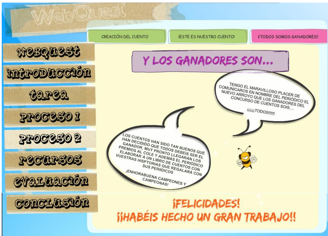
Figura 11. Proceso 2. ¡Todos somos ganadores! Séptimo subproceso de la webquest vertebradora del proyecto.

Para finalizar la parte de los procesos, los alumnos se encuentran con el séptimo subproceso en el que con un pequeño dialogo se les comunica que todos son ganadores del concurso y que todos han hecho un excelente trabajo. Aquí se incluye una parte importante del fomento de la motivación y la autoestima ya que todos los alumnos se sienten orgullosos y con ganas de seguir en sus trabajos. Este apartado de la webquest ha sido utilizado en la actividad ocho de la puesta en práctica (Ver explicación en anexo I)