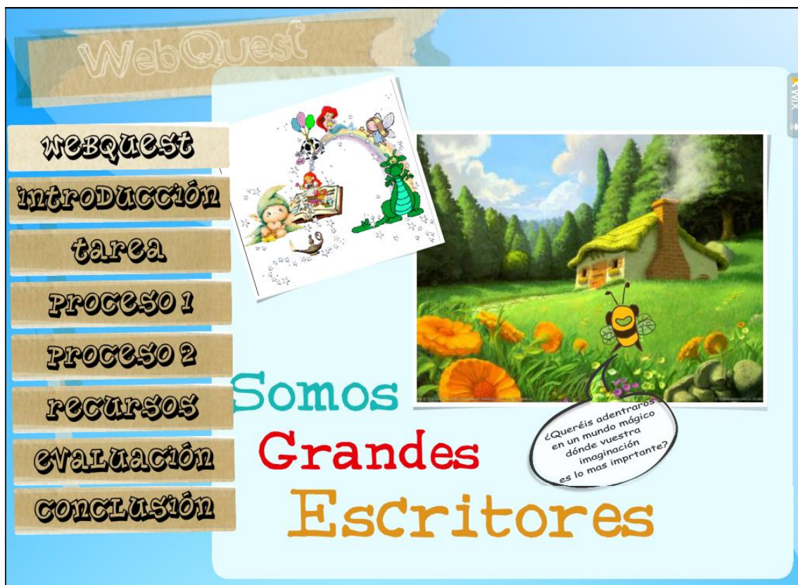
Figura 2. Webquest. Primera página de la webquest vertebradora del proyecto.

La primera parte es la presentación, sirve para situar a los alumnos en el recurso que van a utilizar para llevar a cabo el proyecto. En este caso podemos ver que la presentación incluye el título del proyecto, una pequeña pregunta motivadora y las diferentes partes de las que consta la web. En esta parte el profesor explica en primer lugar qué es una webquest y las diferentes partes que tiene la misma, los alumnos tienen la oportunidad de tener una primera toma de contacto y de hacerse una idea de qué van a tener que hacer. Este apartado de la webquest ha sido utilizado en la actividad 1 de la puesta en práctica ( Ver explicación en anexo I )