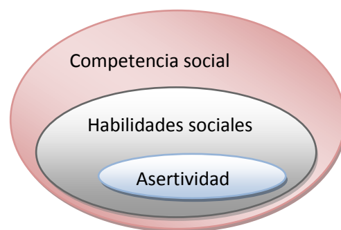
Figura 7. Representación conceptos.

En la actualidad, el concepto de habilidades sociales engloba el de asertividad y a su vez el de habilidades sociales.