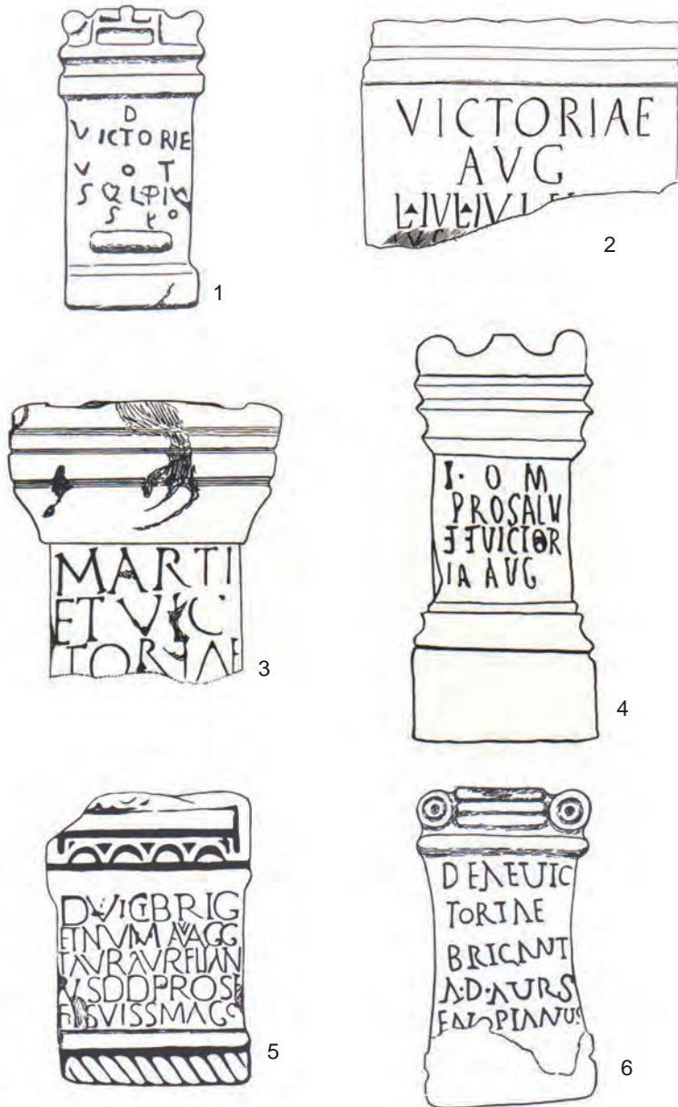
Fig. 3. Altares dedicados a Victoria en Britania: 1- Lanchester (Horsley, 1732); 2- Corbridge (R.G. Colingwood, 1923); 3- Housesteads (R.G.C., 1925); 4- Newcastle (R.G.C., 1923/1936); 5- Greetland (R.G.C., 1936); 6- Castleford (R.G.C., 1923).