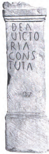
Fig. 5. Altar dedicado a Victoria , Vaison la Romaine (Gascou y Guyon, 2005).