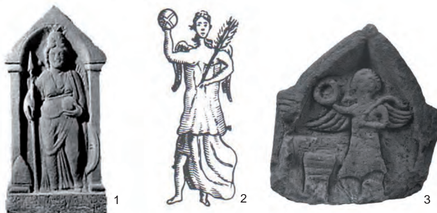
Fig. 4. 1. Brigantia de Birrens (RIB, XIX, 2091); 2. Victoria de Risingham (Horsley, 1732); Victoria de Bolton (Halkon, 1998).

altares, descubierto en Risingham (RIB 1221), dedicado a Mars Victor por Gaius Iulius Publius Pius , tribuno, que hizo otra dedicación a Iupiter Doliqueno (RIB 1220), la diosa Victoria aparece representada junto a Mars de una manera muy particular (Figura 4, n° 2). Aunque la imagen solamente se conserva en un dibujo de Horsley, a su manera de interpretación, lo que impide valorar los rasgos de los dioses, el mismo gesto de sostener el globo en su mano derecha levantada hasta la altura de su cabeza, puede representar un indicativo de su naturaleza autóctona, ya que en ninguna otra representación del imperio tiene paralelos tipológicos.