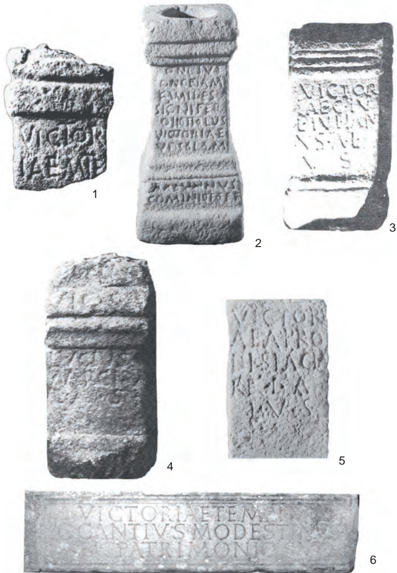
Fig. 1. Altares dedicados a Victoria en Lusitania: 1- Castelo Branco (Garcia, 1979); 2- Fundão ( Arch. Port. 1895); 3 - Salvatierra de Santiago ( CILA , 1996); 4- Talavera la Vieja ( HEp5 , 1995); 5- Idanha-a-Nova ( RAP , 443); 6- Fundão (Mantas, 2002, p. 231).