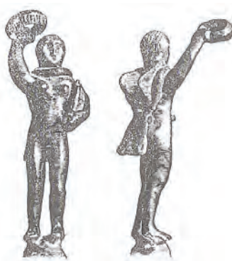
Fig. 2. Victoria de Alcobaça (Vasconcelos, 1913, p.271).

Analizando la pequeña plástica de Victoria en el arte hispano, constatamos que entre los pocos ejemplares que tenemos contabilizados, aproximadamente doce, la mitad de los hallazgos se concentra en la provincia de Lusitania. Se trata de un sarcófago de Evora, un trozo de pintura mural, un relieve de mármol y una estatuilla de bronce de Emerita Augusta y otras dos estatuillas de bronce de Pombalinho y Alcobaça. Quizás solamente los últimos dos ejemplares se pueden incluir en este estudio, aunque fueron encontradas al margen de la zona estudiada. La pequeña estatuilla de Pombalinho, del siglo I-II d.C., atribuida por Rodríguez Oliva (1990) a Victoria se conserva en el Museo Nacional de Arqueología y Etnología de Lisboa. Desgraciadamente no disponemos de ninguna imagen suya. La segunda es también una estatuilla de bronce, de Alcobaça (Figura 2), que representa a la diosa alada sobre el globo, con palma y corona (Vasconcelos, 1913, 271). La ejecución pobre, la manera de representación a la diosa, desnuda, con las alas muy poco marcadas, los brazos muy gruesos y los rasgos faciales, la pieza en general es la expresión de un arte mucho más simplista y provincial.