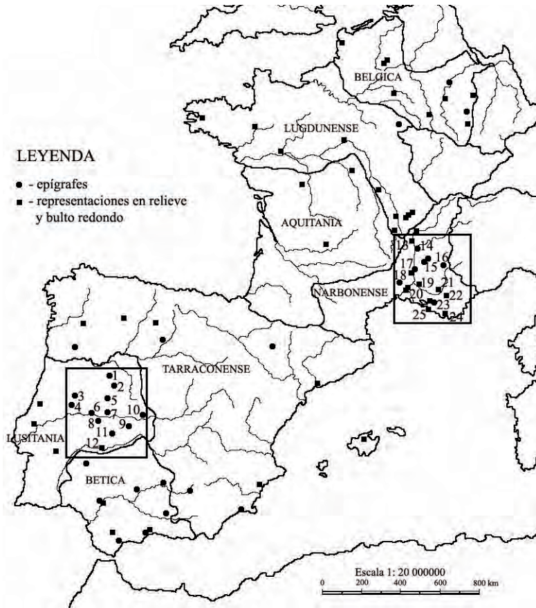
Mapa 1. Distribución de los hallazgos arqueológicos que atestiguan el culto a Victoria en el occidente del Imperio Romano; Hispania - 1. Ciudad Rodrigo ( Mirobriga ), 2. Lerilla, 3. Bobadela, 4. Tábua, 5. Sabugal, 6. Póvoa de Atalaia (Fundão), 7. Idanha-a-Velha, 8. Castelo Branco, 9. Trujillo ( Turgalium ), 10. Talavera la Vieja ( Caesarobriga ), 11. Salvatierra de Santiago, 12. Mérida ( Emerita Augusta ); Galia - 13. Romanette, 14. Aoste ( Augustum ), 15. Vaison-la-Romaine ( Vasio Vocontiorum ), 16. La Bâtie-Montsaléon ( Mons Seleucus ), 17. Orange ( Arausio ), 18. Nîmes ( Nemausus ), 19. Cavailon ( Cabellio ), 20. Arles ( Arelate ), 21. Cucuron, 22. Trets, 23. Aix-en-Provence ( Aquae Sextiae ), 24. Toulon ( Telo Martius ), 25. Marseille ( Massalia ).