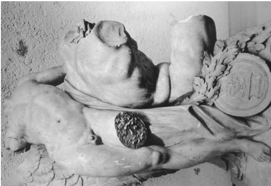
Fig. 3. Roberto Michel. El Genio de la Escultura . Real Academia de Bellas Artes de San Fernando, Madrid. E-299.