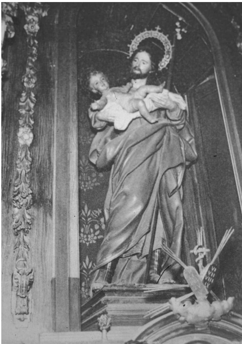
Fig. 5. Juan Pascual de Mena, San José, Carmelitas de Talavera de la Reina.