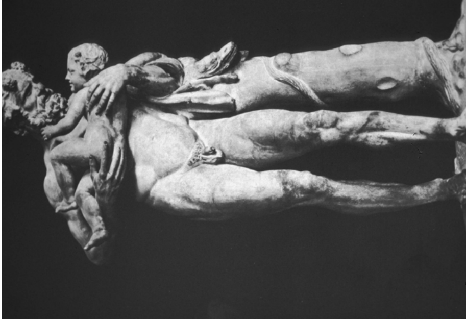
Fig. 4. Sileno con Baco niño , conocido en el S. XVIII como "Saturno". Museo del Louvre, París.