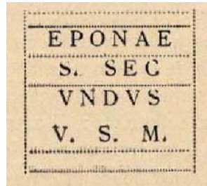
Fig. 3. Texto del ara de Sigüenza (Guadalajara).