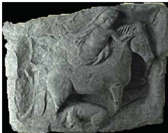
Fig. 1. Relieve de la diosa Epona. Allerey (Francia).