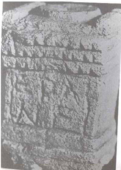
Fig. 5. Ara de Monte Bernorio (Palencia) (Hernández Guerra, 1994).