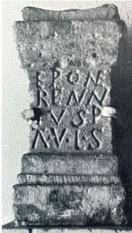
Fig. 4. Ara de Lara de los Infantes (Abásolo, 1974).