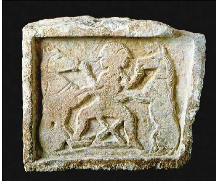
Fig. 7. Relieve de Villaricos (Almería).