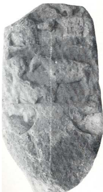
Fig. 6. Estela anepígrafa de Aguilera (Soria) (Jimeno, 1980).