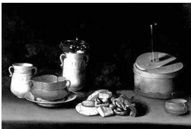
Fig. 5. Juan van der Hamen y León, Bodegón con loza y dulces , 1627. Museo Thyssen. Madrid.

Pero como ya apuntáramos en las primeras páginas de este trabajo, las clases sociales acomodadas del Valladolid de los siglos XVI y XVII incorporaron en sus ajuares cerámicos “de lujo”, además de porcelanas y todo un elenco de imitaciones, otros objetos cerámicos, fabricados con barro rojo –y también, aunque en menor medida, con barro blanco-, a los que se ha venido en llamar búcaros 19 (Fig.5).