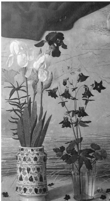
Fig.1. Hugo van der Goes, Triptico Portinari (detalle), h.1482. Galleria degli Uffizi, Florencia.

regla general, en su mayoría aparecen entre los ajuares del pueblo llano. En 1534, la viuda de un pellejero declara entre sus bienes tres escudillas pintadas de las de Málaga, dos platos del mismo baño y un jarro pintado de Málaga 4 . Bernardino Castañeda, procurador de causas de la Real Audiencia de la Chancillería , disfrutaba de un plato de barro de Málaga, dos platos de Málaga pequeños y tres taças de Málaga de orejas 5 . Por el momento, la fecha más tardía en la que podemos constatar su presencia, es el año 1588 6 .