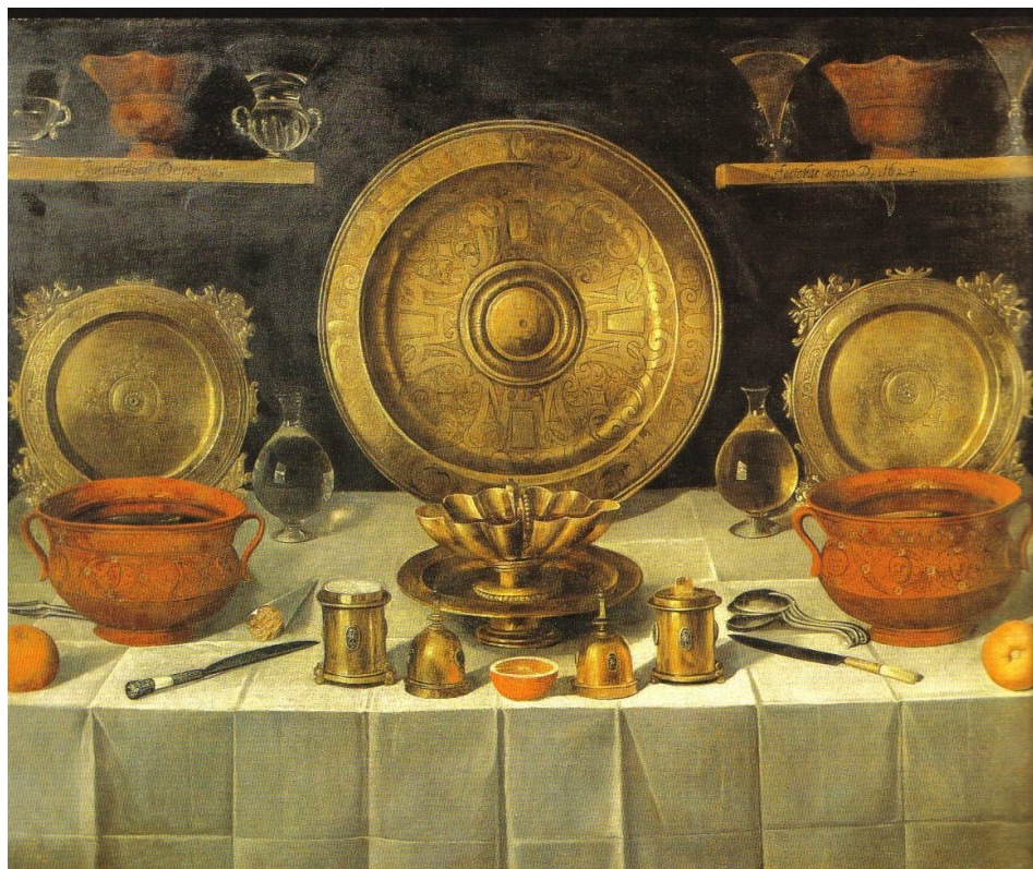
Fig. 6. Juan Bautista de Espinosa, Bodegón con objetos de orfebrería , 1624. Colección Masaver.

También documentamos la presencia de barros fabricados en Lisboa y Torre 34 , localidad esta última que no hemos sabido identificar. Aunque no sea concluyente, de los once lugares que en la actualidad conservan éste nombre, tres de ellos se encuentran en la región del Alentejo, relativamente cerca de la actual frontera con España, más concretamente junto a Sabugal, en la Sierra da Murracha y en la Sierra da Gardunha, respectivamente.