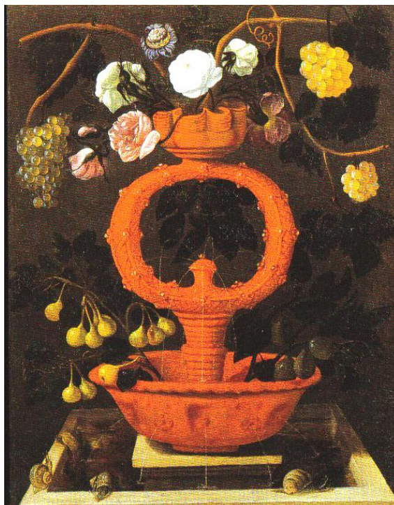
Fig. 10. Juan de Espinosa, Bodegón con flores en una fuente de cerámica h. 1640. Colección Particular.

Para finalizar, y a modo de resumen de todo lo hasta ahora escrito, presentamos un documento en el que se puede apreciar las nuevas tendencias y gustos en la vajilla cerámica introducidos entre la sociedad castellana del Antiguo Régimen. Nos referimos al inventario que en 1636 se realizó de todas las mercadurías existentes en una tienda de vidrio y otros géneros , sita en la Plaza Mayor de Valladolid, posiblemente una de las seis tiendas principales que unos pocos años atrás visitara Tomé Pinheiro en su afán por admirar [...] las vasijas de vidrio de Valladolid [...] nuestros búcaros de Estremoz [...] y otros de Palencia [...] y otros de toda suerte, a que llaman barrilillos, que llevan al pescuezo, como brincos de oro [...] y también muchas porcelanas, por el mismo precio de Portugal [...] (1989: 298-299).