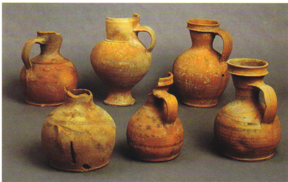
Fig. 7. Jarras del Patio del Siete del palacio de los condes de Requena (Toro, Zamora) (Guía Museo de Zamora, 1999: 63).

En Alba de Tormes, uno de los más importantes centros alfareros de la provincia de Salamanca, se tenían noticias de la recuperación entre los restos de un antiguo convento premostratense, de barros rojos con incrustaciones de cuarzo 36 , que ahora podemos suponer que fueron elaborados en los alfares locales 37 . Otro tanto diremos al respecto del pasado alfarero de la ciudad de Toro (Moratinos y Villanueva, 2005: 19-34) y, en concreto, de un conjunto de objetos cerámicos encontrado en el Patio del Siete del palacio de los condes de Requena, del que destacaban unas jarras hechas con la típica arcilla toresana, de fuerte color rojo, bastante decantado, con juguete al exterior y un acabado a base de bruñido, y decoración a peine, cuya combinación y abundancia dan un cierto barroquismo a las piezas (Larrén, 1992) (Fig. 7).