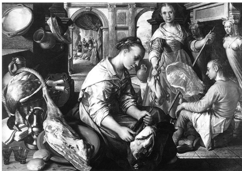
Fig. 4. Joackim Beukelaer, Cristo en casa de Marta y María , 1565. Museés Royaux des Meaux-Arts, Bruselas.

Junto a todas las producciones hasta ahora presentadas, es relativamente común encontrar en los inventarios, principalmente durante la segunda mitad del siglo XVI, unas cerámicas a las que se llama barro de flandes , algunas de ellas incluso con su tapador de estaño. En los bodegones flamencos con escenas de cocina suelen representarse unas piezas, generalmente jarras de barro rojo y sobrecopa metálica, que por su perfil bien podrían encajar con estas cerámicas (Fig. 4). Si esto fuera cierto, y a tenor de las características que se adivinan de la observación de las pinturas, podríamos encontrarnos ante unas manufacturas que guardarían una gran semejanza con las conocidas en Alemania como stoneware o gres salado , cerámicas de pastas duras hechas a molde de una gran calidad y producidas igualmente durante la segunda mitad del siglo XVI (Pleguezuelo, 1999: 259, fig. 13).