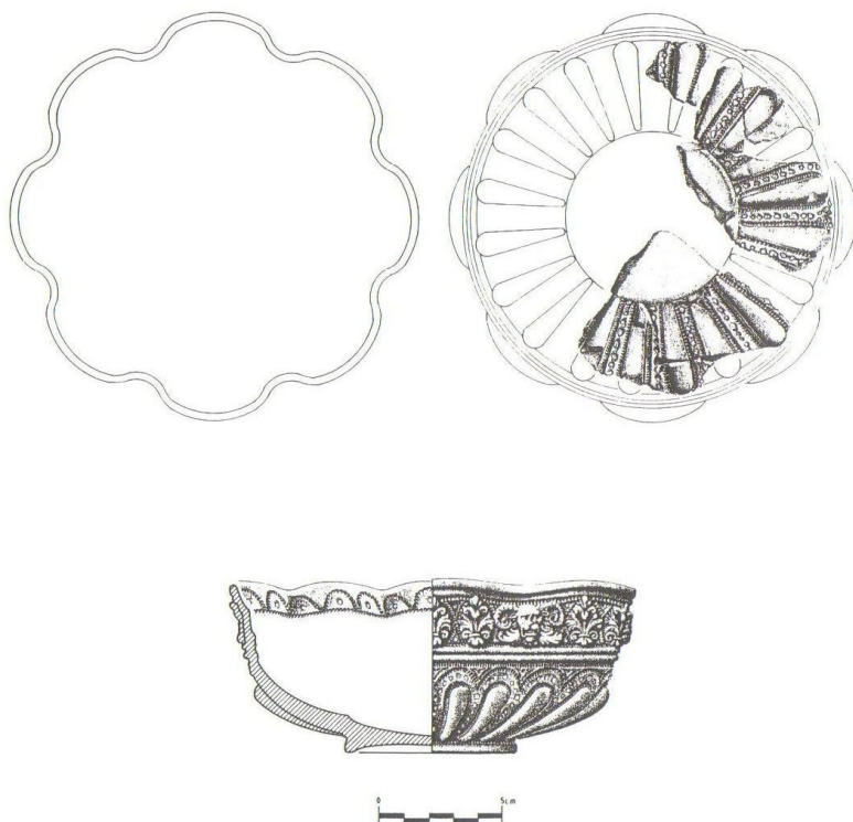
Fig. 9. Cerámica bucarina tipo orfebre , San Benito (Valladolid) (Arqueología en San Benito, 1995: 24).

medieval y de las interesantes piezas halladas en diferentes puntos del recinto urbano histórico 42 (Fig. 9). Tampoco lo hemos hecho de las producciones de Palencia, cerámicas que el viajero portugués Tomé Pinheiro menciona durante su estancia en Valladolid y a las que compara de manera elogiosa con las de Estremoz: que en nada se diferencian sino en no ser tan bueno el color, pero más perfectos, ligeros y labrados (1989: 299).