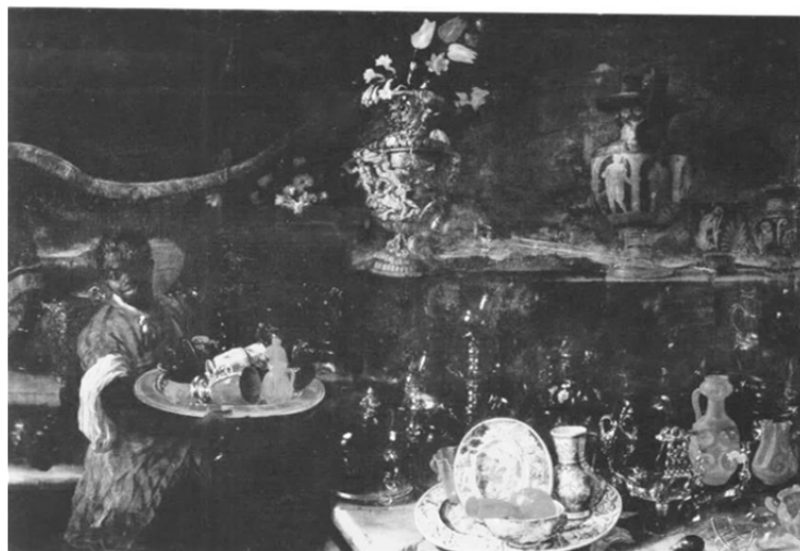
Fig. 3. Giuseppe Recco, Bodegón con un criado negro , h. 1680. Fundación Casa Ducal de Medinaceli, Sevilla.