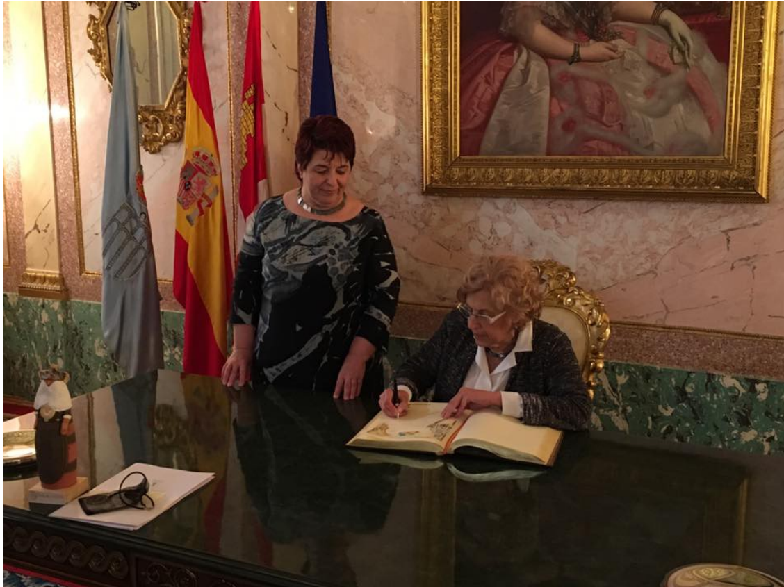
Imagen 6. Recepción de la Alcaldesa de Madrid en el Ayuntamiento de Segovia.