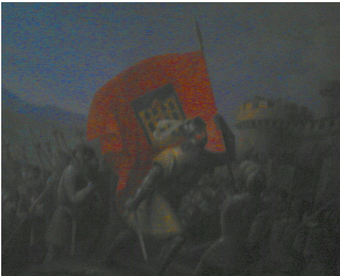
Imagen 3. Techo de la Sala Blanca de la Casa Consistorial en la que aparece el pendón al que hace alusión el primer reglamento de protocolo de Segovia