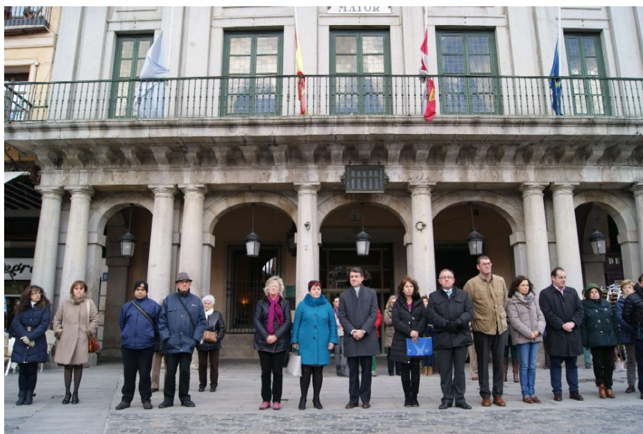
Imagen 5. Luto oficial. Banderas a media asta en la Casa Consistorial.

En la actualización de 2004 se mantiene las banderas a media asta y la mayoría de los actos del entierro tal y como establecía el anterior reglamento, en caso de fallecimiento de un miembro de la Corporación.