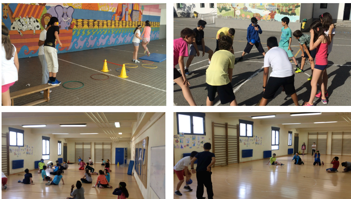
Figura 3. Imágenes de los alumnos realizando las actividades

También mostramos a continuación algunas imágenes tomadas a lo largo de las sesiones de la unidad didáctica