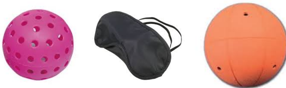
Figura 2. Pelota sonora, antifaz y balón sonoro de goalball

La utilización de materiales, serán los disponibles en el colegio, además de los materiales que aportaré sobre la discapacidad visual, tales como: (1) balones sonoros, (2) gafas de simulación de reducción de visión, etc. (ver Figura ) A continuación podemos ver en las imágenes con el material mencionado.