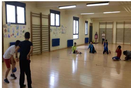
Figura 1. Aula, patio y gimnasio del colegio.

En los casos donde contamos con alumnos que cuentan con o simulan una discapacidad visual, hemos de tener en cuenta varias ideas clave. Por ejemplo, realizar las diferentes clases de Educación Física siempre en los mismos espacios. Esto ayudará a los alumnos a tener una imagen mental clara del espacio, permitiendo que se puedan desplazar con más seguridad y puedan realizar las diferentes actividades de forma segura.