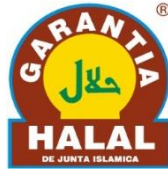
Figura 5: Logo Marca de Garantía Halal. Instituto Halal