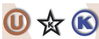
Figura 3: Logos certificadoras Kosher

Es muy importante la investigación en cuanto a la certificación Kosher y sus logotipos en la vida cotidiana de muchos grupos de judíos en Europa (Fischer y Lever, 2016). El sello OU (Orthodox Union) es de EEUU y es el más reconocido. Un producto con sello asegura que ha sido elaborado con ingredientes Kosher y procesado en un equipo exclusivo para alimentos Kosher.