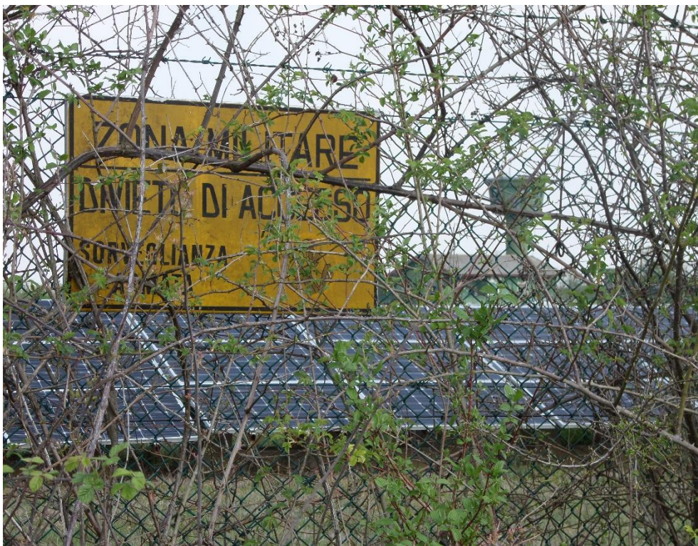
Fig. 1 – L'ex sito Aldebaran, deposito munizioni della Nato ad oggi parzialmente riconvertito a parco fotovoltaico (foto di Federico Camerin, 2017)

In questo contesto emergono alcuni episodi di riconversione militare che hanno mutato l'uso dei beni ex Difesa principalmente come sedi per amministrazioni e enti pubblici 3 . Una tipologia di iniziativa che sta esportando un "modello" di riuso in Italia è il cosiddetto federal building , introdotto dall'articolo 24 del D.L. 66/2014 sulla spending review per la realizzazione di poli amministrativi in un'ottica di razionalizzazione degli uffici pubblici nei beni militari dismessi 4 .