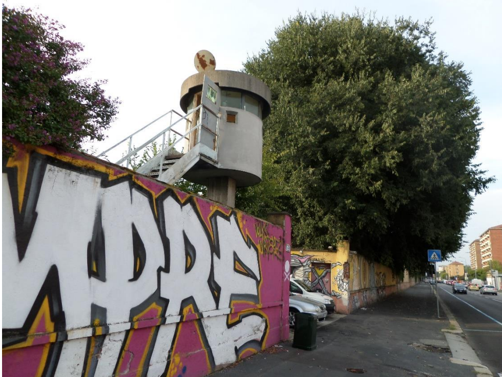
Fig. 2 – Entrata dell'ex caserma Mameli a Milano

Altri tipi di trasformazione, tuttavia sporadici e non diffusi nel territorio italiano, hanno riguardato la realizzazione di strutture di tipo museale 5 , attrezzature di interesse comune 6 , lo smantellamento delle installazioni militari e il riuso dedicato a produzione energetica 7 .