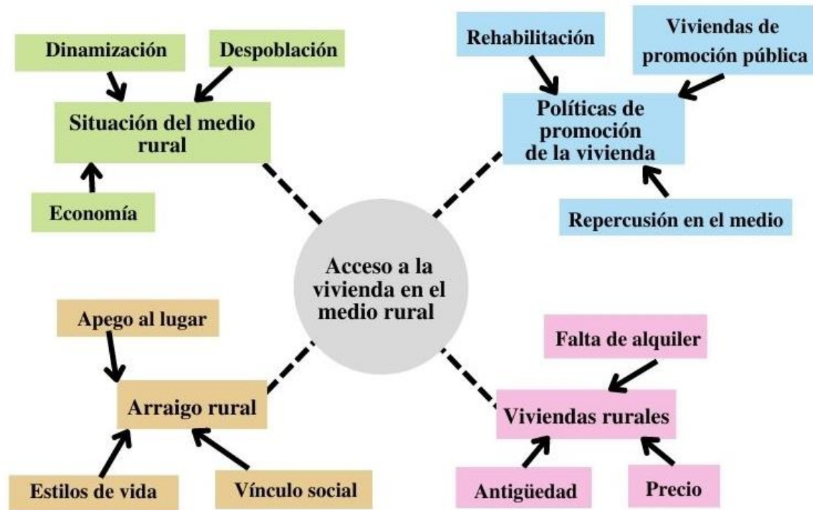
Figura 1. Diagrama de análisis de datos del acceso a la vivienda rural. Elaboración propia

representado en la figura 1. Se irán analizando y explicando cada temática una por una y detenidamente.