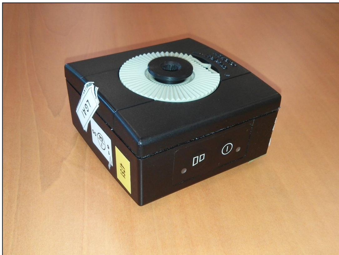
Imagen 4: Calibrador acústico.