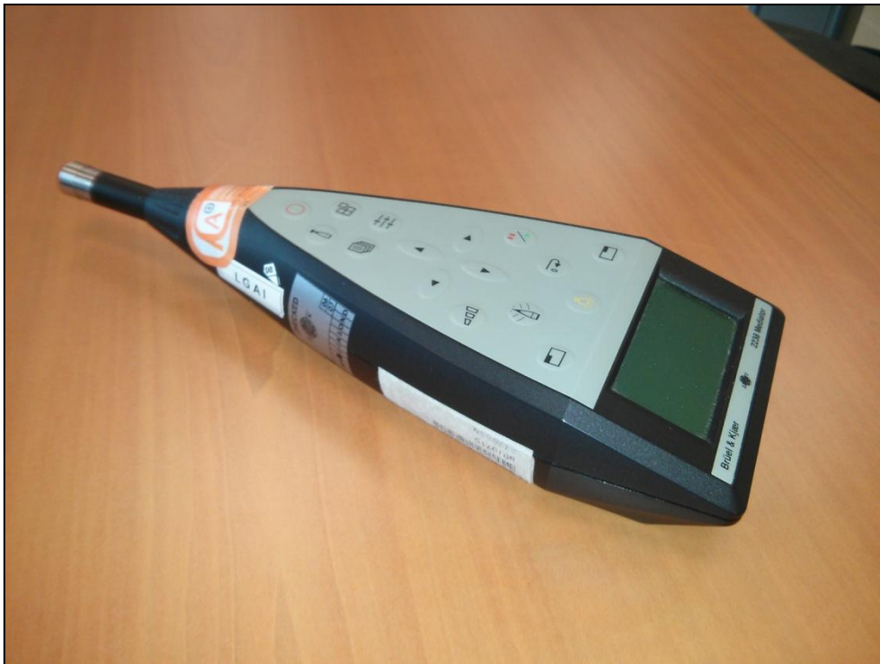
Imagen 2: Sonómetro.