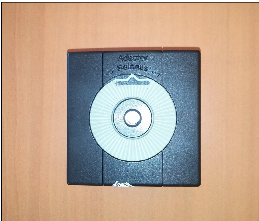
Imagen 3: Calibrador acústico.