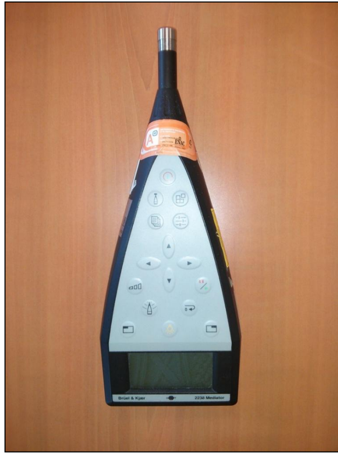
Imagen 1: Sonómetro.