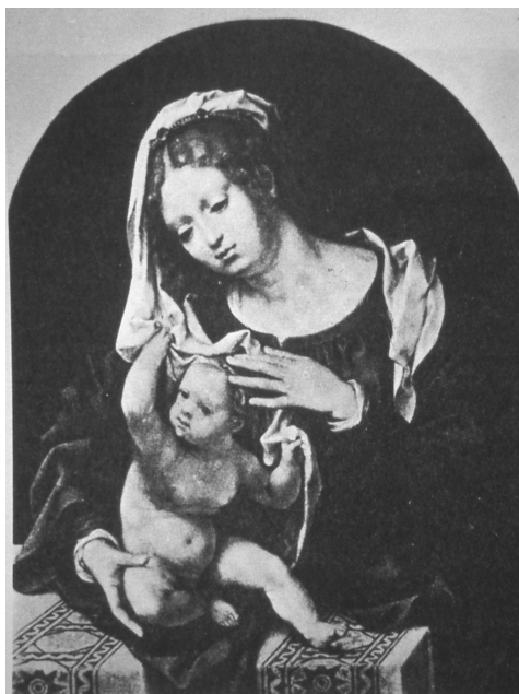
Fig. 2. Gossaert. Virgen con el niño. Maurithuis de La Haya.