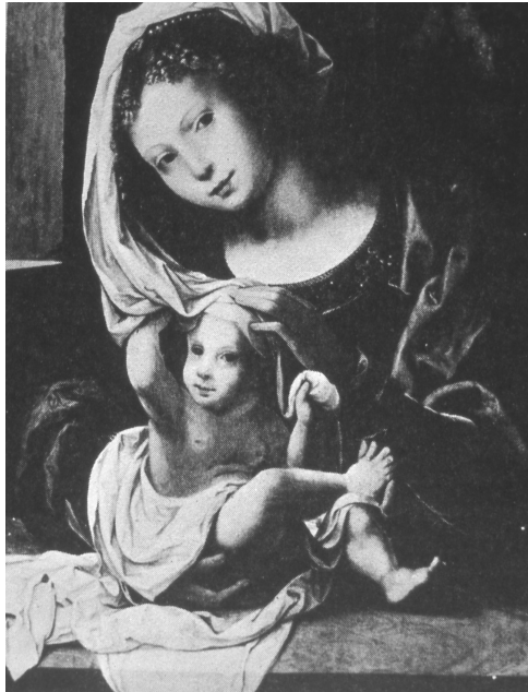
Fig. 4. P. Coeck. Virgen con el niño. Madrid. Colección privada.