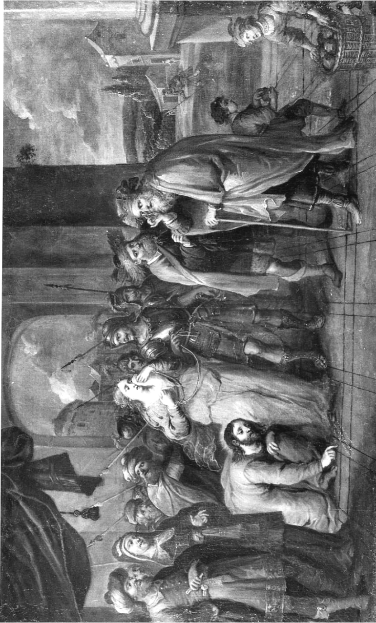
Fig. 5. Antoon Willensens. La mujer adúltera. Mejico, Museo de San Carlos.