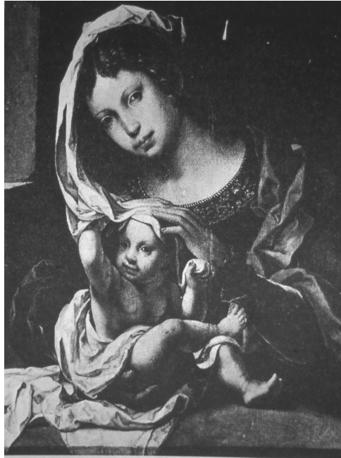
Fig. 3. P. Coeck. Virgen con el niño. Dessau. Staatliche Galerie.