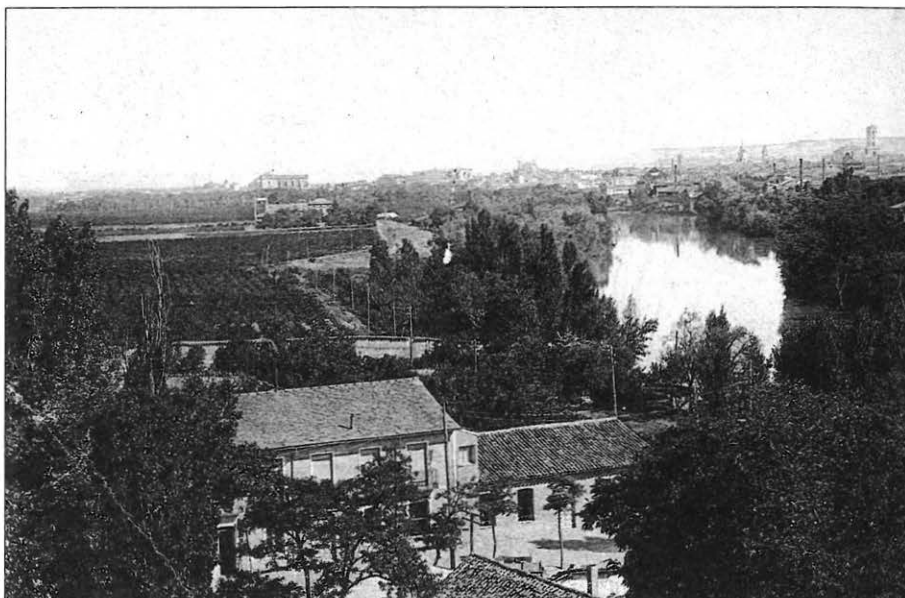
Ilustración 4. «Valladolid: vista general» (principios del siglo XX).