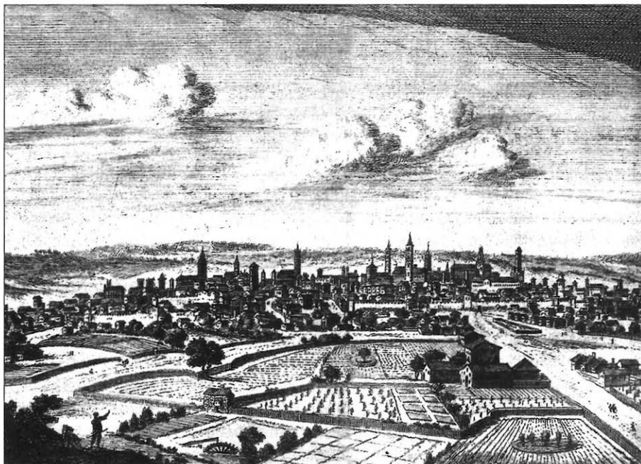
Ilustración 1. Vista de Valladolid. Grabado holandés del siglo XVII, de Pieter van der Berge.