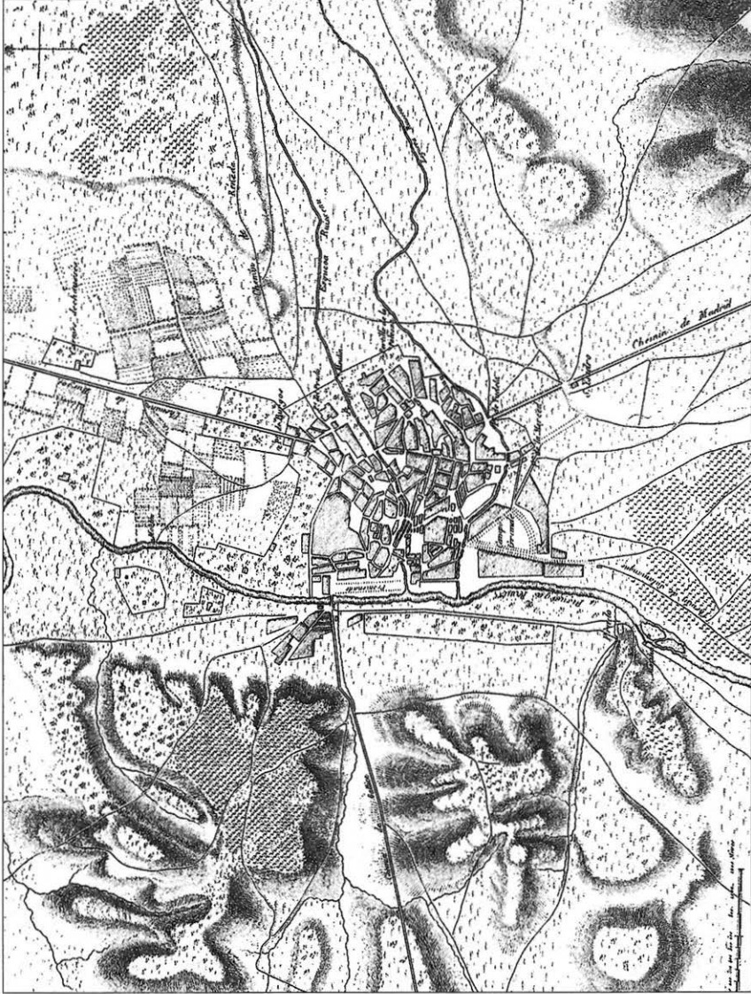
Ilustración 3. Plano de Valladolid y sus cercanías, de la obra Viaje pintoresco e histórico de España , de Alexander Laborde, 1806-1820.