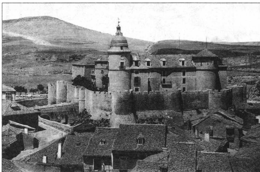
Ilustración 5. «Valladolid. Archivo de Simancas» (imagen histórica).