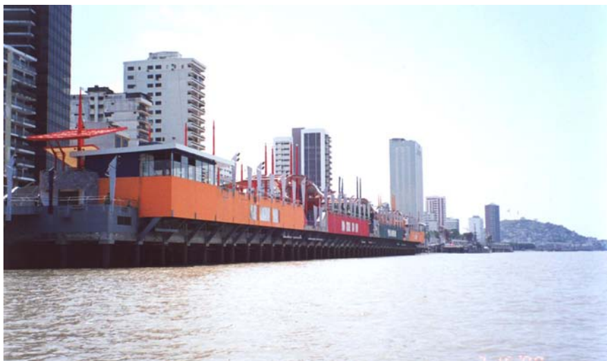
Fig. 2.- Malecón 2000.

A pesar de numerosas intenciones por reconstruirlo, y revertir esta situación, ninguna se concretaría. Sin embargo, sería en el año 1996 cuando comienzan a esbozarse las primeras ideas del proyecto de regeneración del malecón, hoy conocido como Malecón 2000, con lo que los guayaquileños volverían “a ver al Río”.