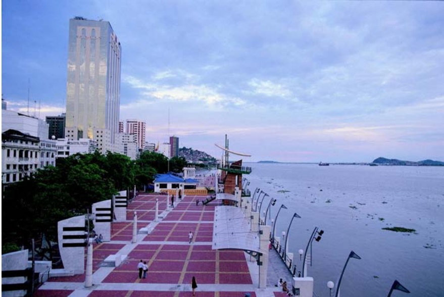
Fig. 3.- Malecón 2000.

El malecón, por su importancia histórica y significación para la ciudad y los Guayaquileños, representa un hito urbano, quizá, único dentro de la estructura de la ciudad. Muy probablemente, la condición de deterioro que presentaba el malecón, hace ya algunos años, reflejaba el estado en que se encontraba la ciudad. Hoy, los guayaquileños sabemos que la recuperación se está alcanzando gracias a ese primer gran proyecto que permitió la regeneración del Malecón y que sentó el cimiento del modelo de desarrollo actual.