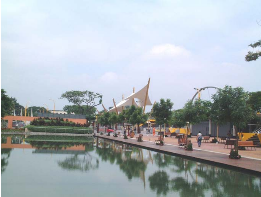
Fig. 5.- Malecón del Salado.

Una de las últimas obras ejecutadas en Guayaquil, y que representa el rescate de un área históricamente importante para los guayaquileños.