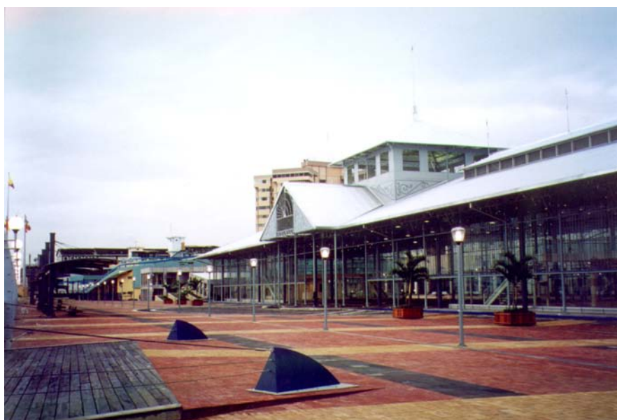
Fig. 5.- Mercado Sur.

Apenas doce años le tomó a Guayaquil transformarse significativamente; hoy, más del 90% de la ciudadanía apoya la gestión municipal y considera que las administraciones han sido notablemente eficaces.