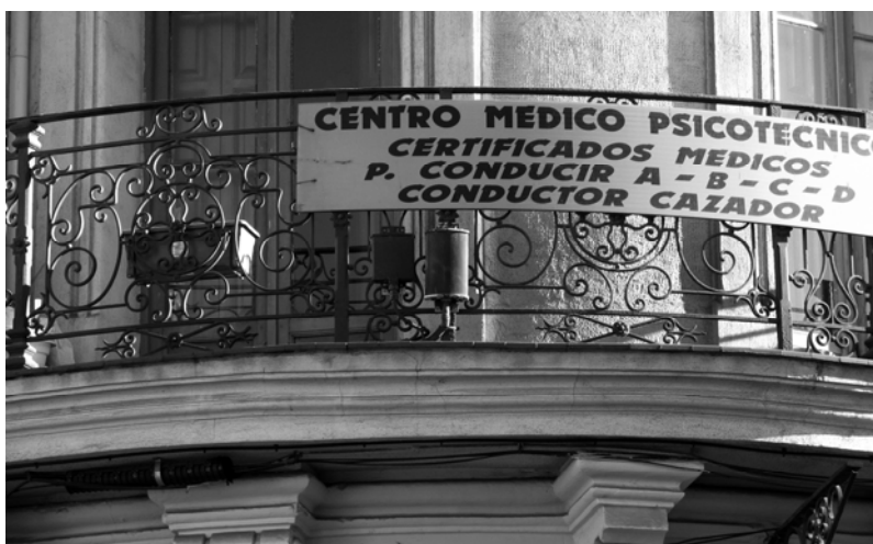
Fig.3. Ejemplo de microceldas. Foto: Mariano Grajal., 2008.

Estará sujeta a los mismos requisitos que la primera instalación la renovación o sustitución completa de una instalación y la reforma de las características de las mismas que hayan sido determinantes para su autorización o sustitución de alguno de sus elementos relevantes por otros de características diferentes a las autorizadas 18 .