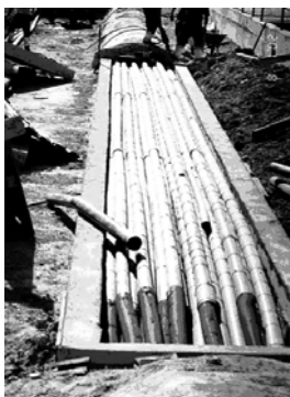
Fig.4. Ejemplo de exceso de tuberías para cableados en una canalización.

La canalización para telecomunicaciones discurrirá por debajo del resto de servicios, excepto el saneamiento, aumentando el espesor de la zona de relleno bajo el firme cuanto sea necesario para ello. Si la canalización de telecomunicaciones debe discurrir en paralelo con otros servicios, deberá hacerlo al lado de éstos, nunca por encima o por debajo. Cuando sea precisa la adopción de otras soluciones para el trazado de las canalizaciones, como es el caso de las galerías, o el trazado subterráneo no sea viable por cruzar corrientes de agua, o tener que discurrir por puentes o túneles en voladizo, se deberán tener en cuenta los criterios de seguridad, mantenimiento y mínimo impacto 25 .