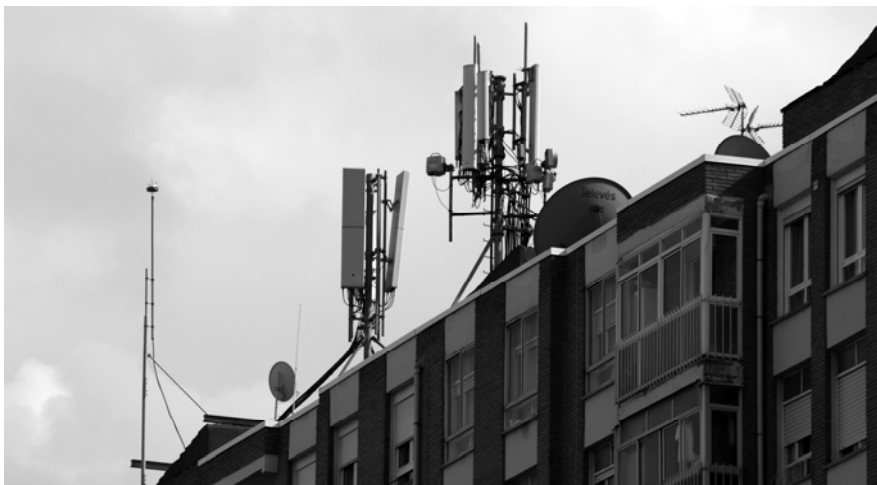
Fig.2. Ejemplo de amasijo de instalaciones sobre la cubierta de un edificio residencial: pararrayos, antenas convencionales de televisión, antenas parabólicas y, sobre todo, instalaciones diversas de transmisión de telefonía celular.

En polígonos industriales de nueva creación en algunas ordenanzas solamente se permitirán estas instalaciones en parcelas previstas en el planeamiento para equipamientos. En polígonos industriales ya existentes donde lo previsto en el párrafo anterior no sea factible, al ubicar las instalaciones deberán respetarse, en la medida de lo posible, las distancias mínimas a linderos y demás normativa aplicable, colocándose el Recinto Contenedor acorde con la construcción 11 .