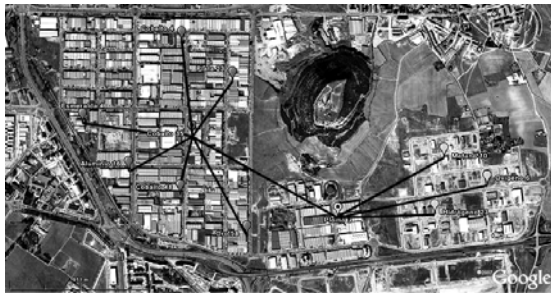
Fig.5. Ejemplo de planificación de un proyecto WIFI en un polígono industrial.

La problemática específica de los pequeños núcleos de población hace, también para los cableados en la vía, que no sea tan rígida su aplicación y que la mayoría de las veces la ordenanza, si la hay, sea la misma para todos los cableados, dando más importancia a las redes eléctricas y a los cables de la antigua Compañía Telefónica Nacional de España. Las nuevas instalaciones de redes de telecomunicaciones tienen menos repercusión; sin embargo, hasta hace pocos años lo habitual para las compañías instaladoras era apoyar los cables en las fachadas de los edificios o bien en postes, como ha ocurrido con instalaciones eléctricas, de telefonía o telegrafía durante los últimos años.