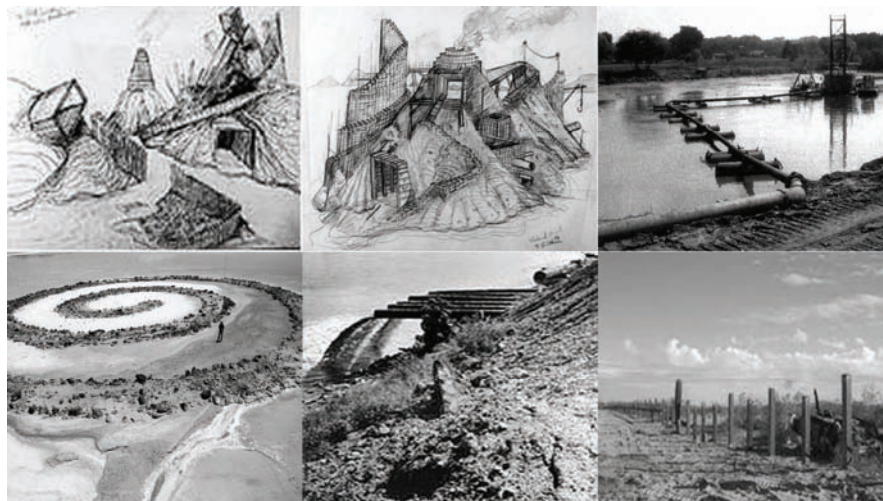
Fig. 6: Paisajes entrópicos de Robert Smithson.

(Latz, 1999). En este caso se ha tratado de conciliar planes de conservación del patrimonio industrial, un funcionalismo dotacional y la implantación de vegetación en consonancia con un naturalismo estratégico. Se consigue así un parque paisajístico y un campus de la memoria industrial, sobre una extensión superior de 200 hectáreas.