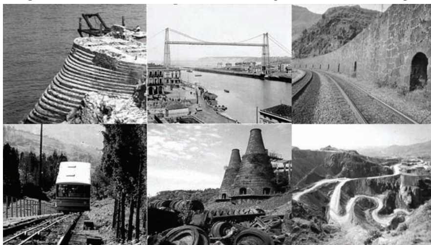
Fig. 3: El paisaje del hierro en Vizcaya.