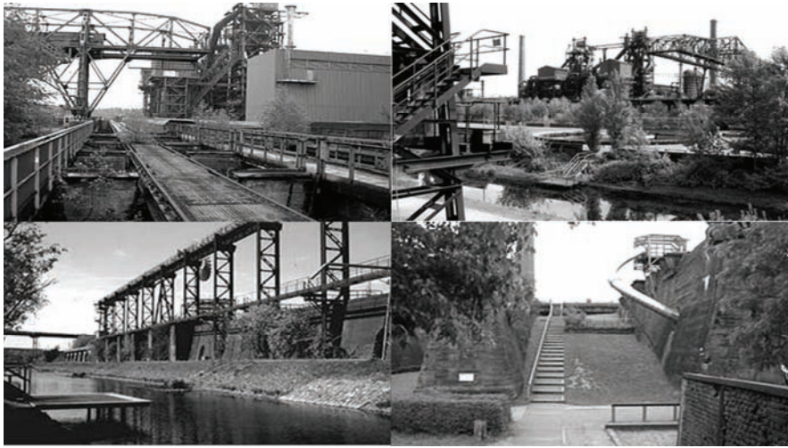
Fig. 7: Diusburg Nord, Park.

Los nuevos supuestos de un “ecohumanismo” tratan aquí de compatibilizarse con una percepción sensible de lo degradado, la fascinación formal de las ruinas industriales (Marrodán, 2007). Este nuevo paisajismo trata de desviarse del camino conducente a las intervenciones de carácter mítico-simbólico en el medio apoyándose en los valores antropocéntricos y tecnológicos que actúan como deudores de la cultura ilustrada derivada hacia una actual cultura de masas. Destilan actualidad como dominio de actuación del arte que interviene sólo como sustitución gratificante de la falta de armonía en el entorno contemporáneo y como mediador en la angustia y desazones emocionales causadas por el deterioro del medio ambiente.