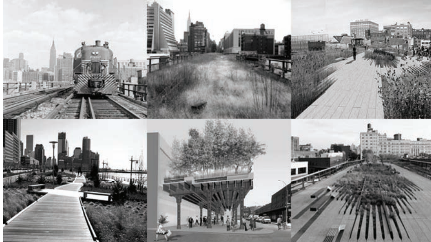
Fig. 5: New York High Line.

como un aspecto de ésta (Álvarez, 2007, Trachana, 2008). Esta visión supone una crítica a la visión jerarquizada de la realidad que tiene su origen en la Ilustración con la separación de la idea de las cosas materiales -que también pueden expresar ideas: ideología-