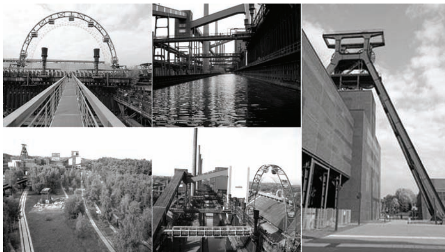
Fig. 9: Zollverein Park, Essen.