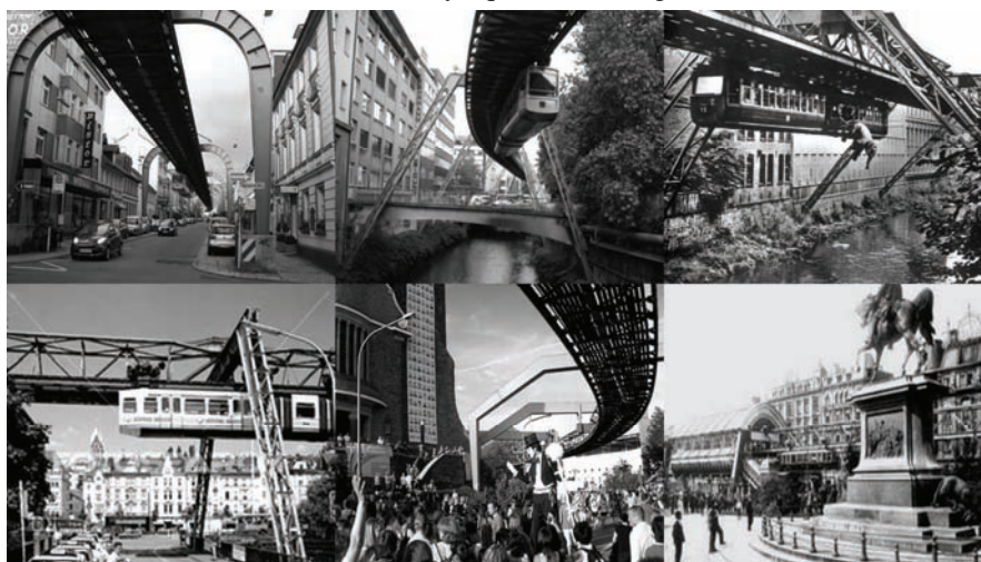
Fig. 4: Schwebelbahn de Wuppertal.

técnicamente factible y socialmente rentable intentar la repristinación del paisaje, eliminando los elementos añadidos y reponiendo aquellos que en su día fueron suprimidos. Pero es de temer que el resultado de esta imposible marcha atrás en el tiempo quedaría reducido a una esperpéntica copia de sí mismo o, en el mejor de los casos, a una buena labor de jardinería a gran escala. Las alternativas más lógicas pasan necesariamente por la conservación y la reutilización, lo que en ambos casos significa asumir el hecho industrial como componente básico de un proyecto ulterior. La misión del restaurador es entonces doble: proceder con el método del arqueólogo, para estudiar el instrumento de la producción en su contexto -físico, económico y social- tratando de eludir su extinción definitiva; y proponer funciones alternativas ubicadas en la perspectiva cultural, pero que sean compatibles con otras perspectivas que potencien la necesaria recuperación económica y social de las áreas deprimidas al cesar la actividad industrial. Y para ello, restaurar y rehabilitar la estructura material y recomponer el paisaje en su unidad formal, coherencia funcional y equilibrio ecológico.