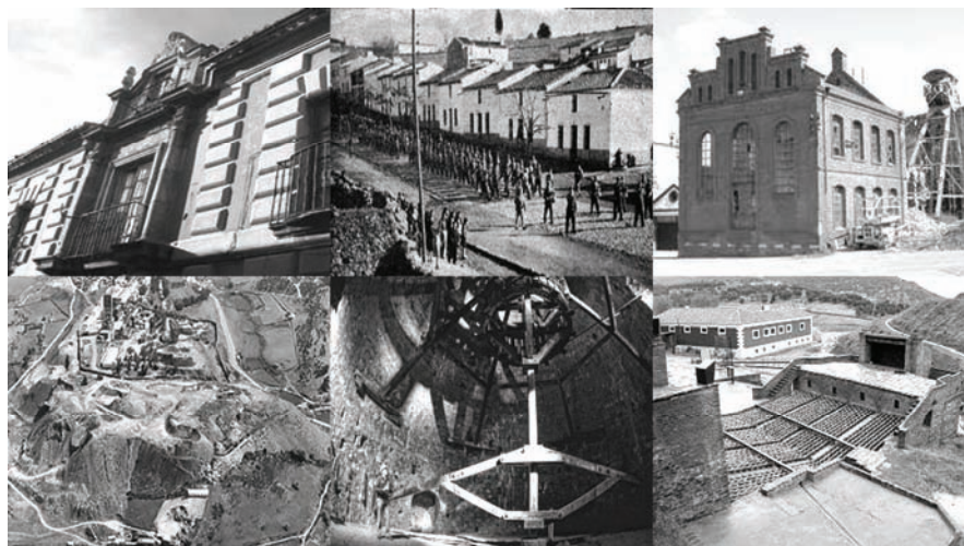
Fig. 2: Parque de Almadén.

El ferrocarril forma parte del paisaje de las minas y de otras grandes industrias que se emplazaban siempre dependiendo del ferrocarril.