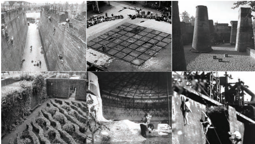
Fig. 8: Diusburg Nord, Park.

Los nuevos supuestos de un “ecohumanismo” tratan aquí de compatibilizarse con una percepción sensible de lo degradado, la fascinación formal de las ruinas industriales (Marrodán, 2007). Este nuevo paisajismo trata de desviarse del camino conducente a las intervenciones de carácter mítico-simbólico en el medio apoyándose en los valores antropocéntricos y tecnológicos que actúan como deudores de la cultura ilustrada derivada hacia una actual cultura de masas. Destilan actualidad como dominio de actuación del arte que interviene sólo como sustitución gratificante de la falta de armonía en el entorno contemporáneo y como mediador en la angustia y desazones emocionales causadas por el deterioro del medio ambiente.