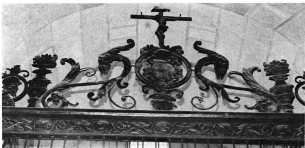
Torrelaguna. Iglesia parroquial: 1. Reja de la capilla de los Vélez.—2. Reja.—3. Detalle de la reja anterior.—4. Remate de una reja.