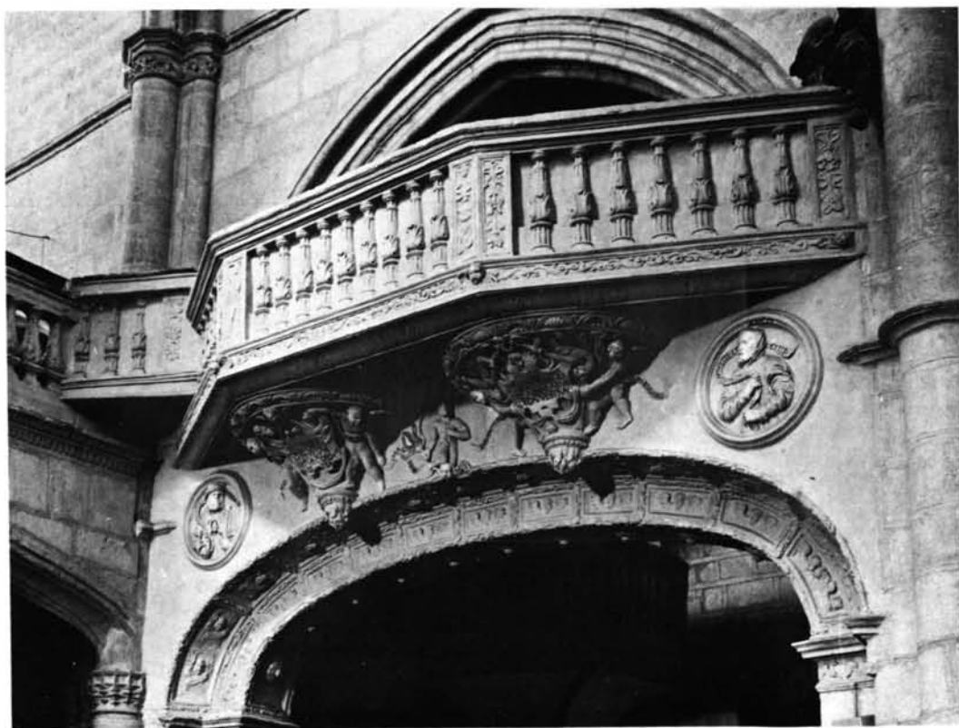
Torrelaguna. Iglesia parroquial: 1. Exterior.—2. Portada.—3. Púlpito.—4. Tribuna del coro.