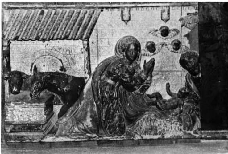
Torrelaguna: 1. Detalle de la portada del convento de Concepcionistas.—2. Iglesia parroquial. Retablo de la capilla de los Vélez.—3. Iglesia parroquial. Relieve de la Epifanía, de un retablo colateral.—4. Relieve del Nacimiento, de un retablo colateral.