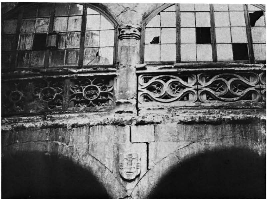
Valladolid. Casa de las Veneras: 1. Plano de Ventura Seco, de la zona donde se erigió la Casa. El número 95 corresponde a la Universidad; el 96 es el Colegio Mayor de Santa Cruz.—2. El patio tal como se hallaba.