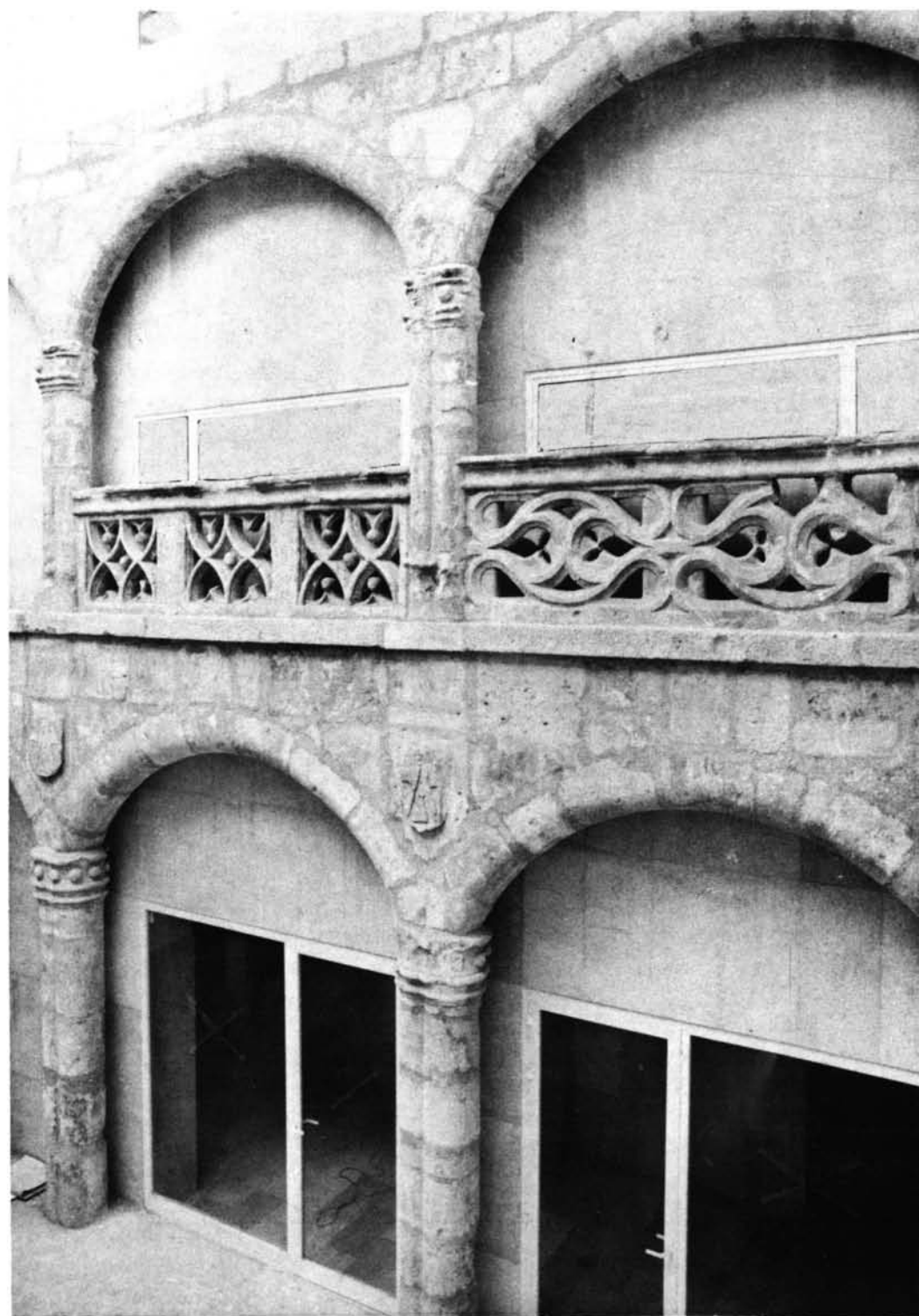
Valladolid. Casa de las Veneras. El patio ya instalado en el nuevo edificio.