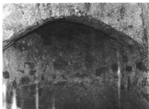
1 a 4. Cambarco (Cantabria). Ermita rupestre.