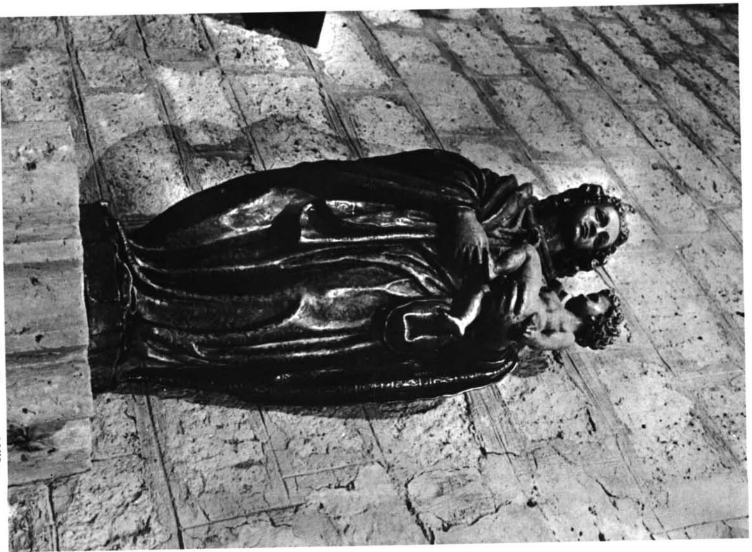
Paredes de Nava (Palencia). Iglesia de Santa Eulalia. Virgen con el Niño, por Esteban Jordán.