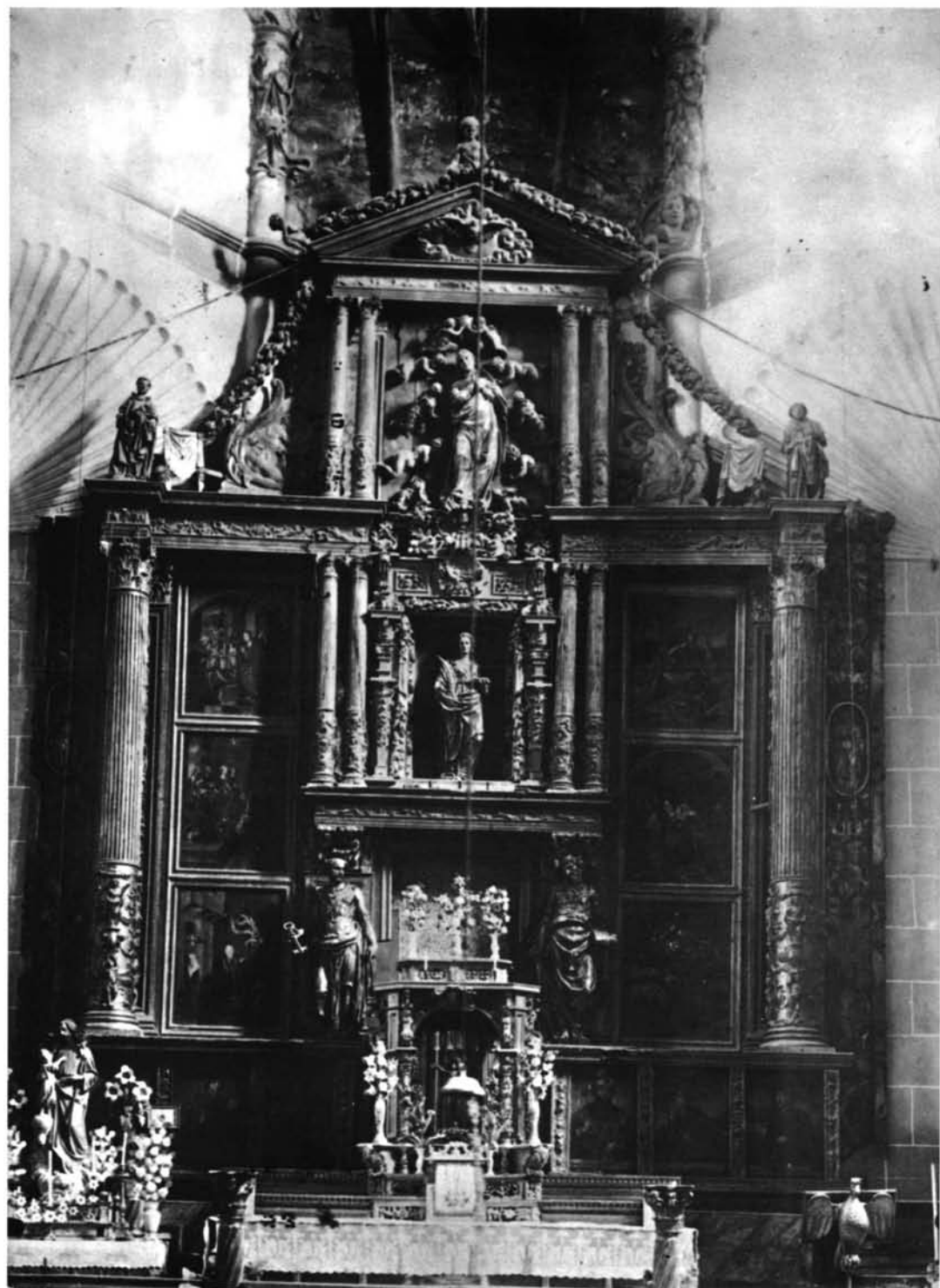
Paredes de Nava (Palencia). Iglesia de Santa Eulalia. Retablo mayor, con las modificaciones introducidas en el siglo XVIII.