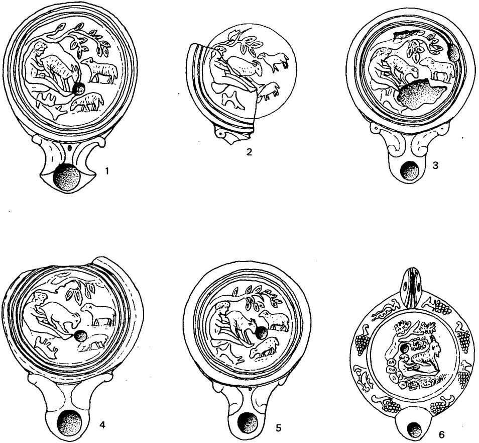
Fig. 3. Lucernas con escenas de ordeño: 1, Bailey A (=Loeschcke I); 2 a 5, Bailey B (=Loeschcke IV); 6, Bailey O (=Loeschcke VIII).