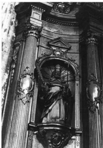
Cigales (Valladolid). Iglesia parroquial: 1 a 4. Detalles de los Retablos de Santo Domingo y de la Virgen del Rosario.