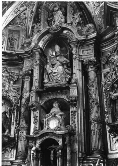
Valladolid. Iglesia de San Pedro: 1. Retablo de la Virgen de los Dolores.—2. Retablo mayor.