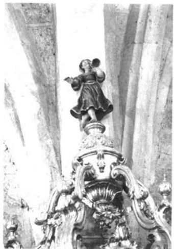
Sardón de Duero (Valladolid): 1. Retablo de San Norberto.—2. Retablo de Santa Gestrudis.—3 y 4. Villanubla (Valladolid). Iglesia parroquial. Tornavoz.