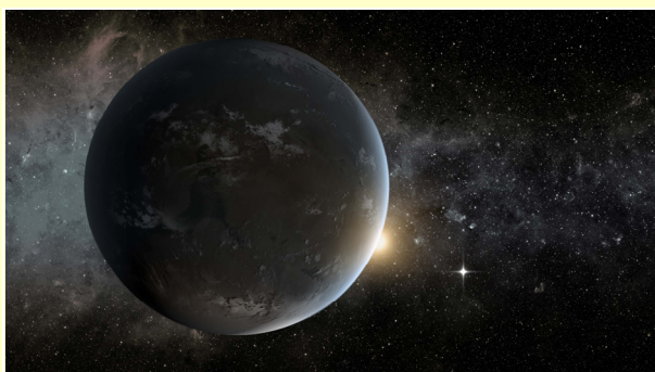
Figura 1 Representación artística de uno de los exoplanetas detectados por Kepler.

Un equipo de astrónomos ha anunciado el descubrimiento de ocho nuevos planetas en las zonas habitables de sus respectivas estrellas, encontrándose en órbita a una distancia a la que el agua líquida puede existir en la superficie del planeta. Esto duplica el número de planetas pequeños (con menos del doble del diámetro de la Tierra) que se piensa que están en la zona habitable de sus estrellas progenitoras. Entre estos ocho, los astrónomos han identificado dos que son los más parecidos a la Tierra de todos los exoplanetas conocidos hasta la fecha.