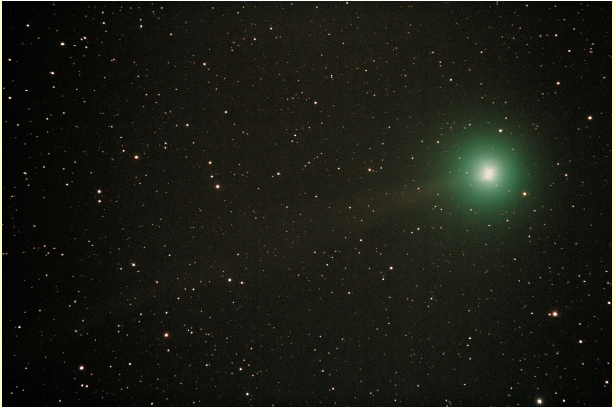
Figura 1. Cometa Lovejoy el día 29 de diciembre de 2014.