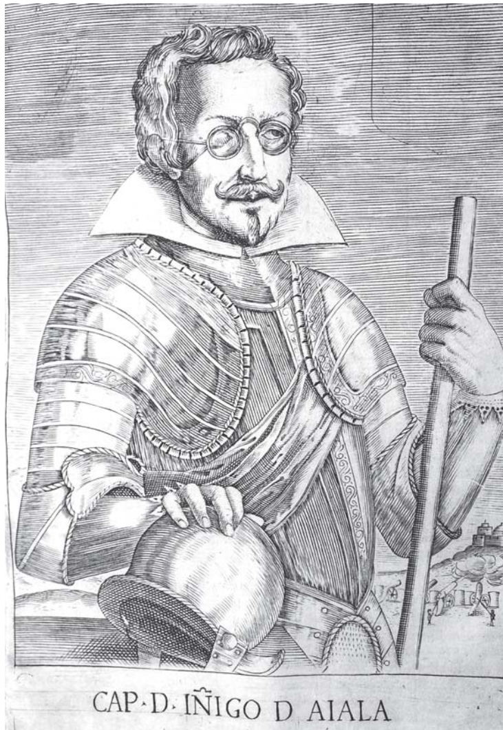
Fig. 6. Retrato de Íñigo de Ayala.

sionera de los jesuitas por el nuevo mundo y “la necesidad espiritual, que tienen aquellos gentiles y cristianos nuevos de quien les predique, y enseñe las cosas de la fe” 70 . El octavo libro es el más extenso y en él se rinde cuentas de la dedicación y entrega de sus hermanos jesuitas que, exhaustos, necesitan compañeros para seguir su labor evangelizadora. La evangelización contribuyó a que los cronistas religiosos conociesen y se implicasen en las realidades de los países conquistados, sin olvidar el objetivo de su viaje, “comprender para evangelizar” 71 .