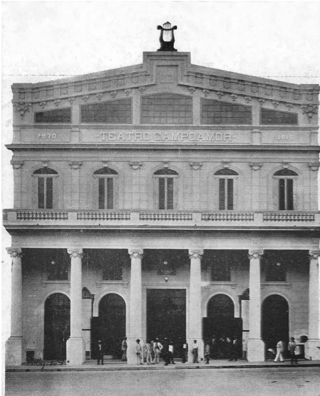
Fig. 4: El Teatro Campoamor de La Habana en 1915, apenas inaugurado.