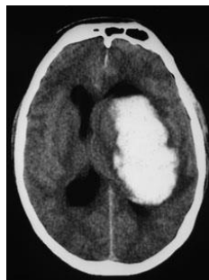
Ilustración 2: Hemorragia intraparenquimatoso de ganglios basales izquierdos, colapsa ventrículos laterales. (25)

Tras llegar al Hospital Clínico Universitario de Valladolid y ser evaluado por neurología de guardia, se observa en el TAC (herramienta fundamental para el diagnóstico de los Ictus) un hematoma intraparenquimatoso localizado en la región de ganglios basales izquierdos con un volumen medianamente extenso de 38 cc. con un ligero desplazamiento de línea media de aproximadamente 6 mm (Ilustración 2).