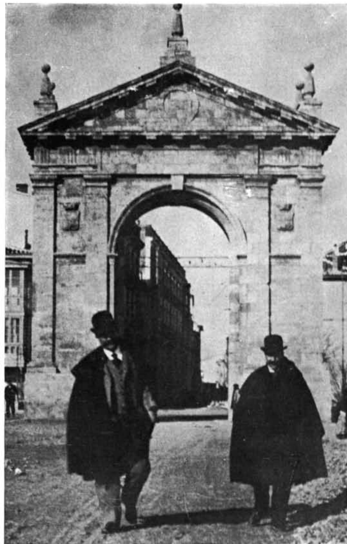
Palencia. Arco del Mercado: 1. Dibujo en el Archivo Municipal de Palencia.—2. Fotografía del arco hacia 1909.