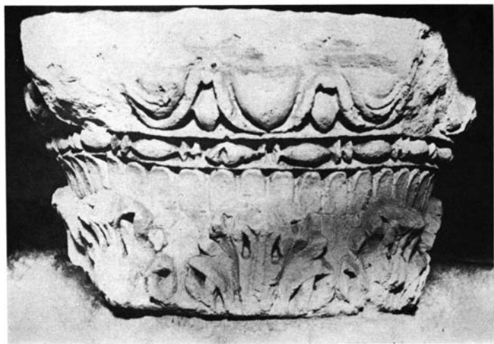
1. Hontoria del Pinar, Capitel n.º 3.—2. Quintanilla de las Viñas, Capitel.