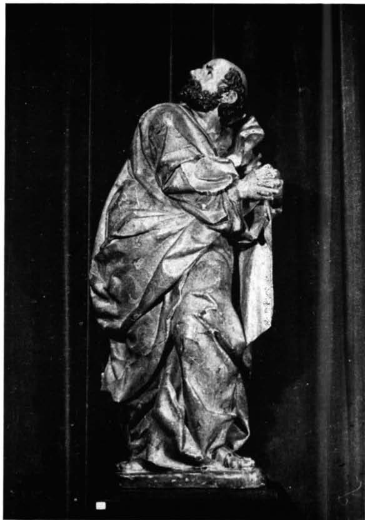
Barcelona. Museo Marés: 1. Dolorosa.—2. San Pedro.