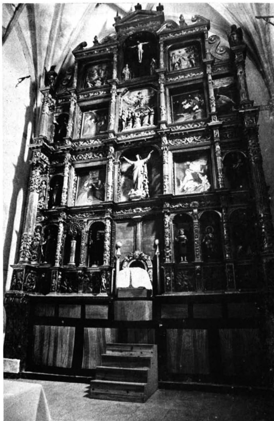
Osa de la Vega (Cuenca). Iglesia parroquial. Retablo mayor.