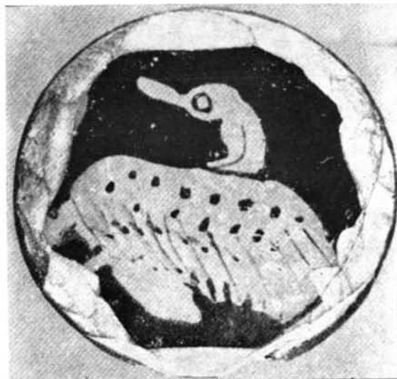
1 a 3. Galera (Granada). Escifo del Grupo del Cisne.—4. Carrascosa del Campo (Cuenca). Medallón recordado de una copa ática con un cisne. Según Almagro Gorbea, BPH, vol. X, lám. XX, 1.