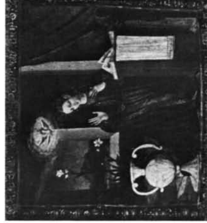
Londres. Wellcome Institute for History of Medicine: 1. Tabla de San Roque.—2. Tabla de San Sebastián.—3. Virgen de la Anunciación. Tabla. Paradero desconocido.