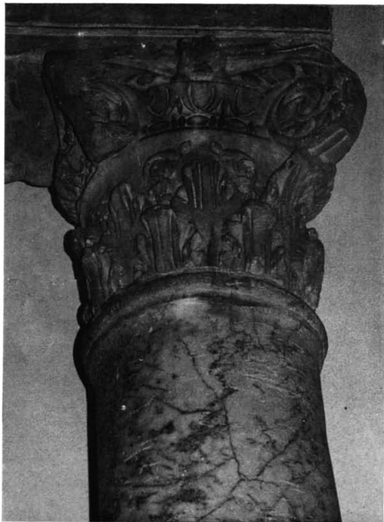
1. Beja. Museo Arqueológico.—2. Tarragona. Museo Arqueológico.—3. Itálica. Museo Arqueológico de Sevilla (Foto facilitada por el Museo.)