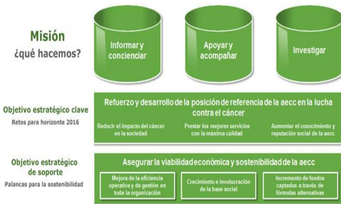
Imagen 4: Objetivos asociación española contra el cáncer

enfermedad tiene en la sociedad de hoy en día, prestando servicios de la máxima calidad posible. 12