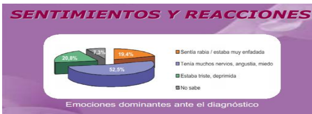
Imagen 2: Sentimientos y reacciones habituales ante la enfermedad de cáncer

En la siguiente gráfica se muestra, como los sentimientos de angustia, miedo y nerviosismo aparecen hasta en el 52.5% de los pacientes oncológicos antes del diagnóstico. Otros sentimientos como la tristeza y la rabia aparecen también en el 20.8% y en el 19.4% de los casos respectivamente. Por último un 7.3% no se siente capaz de identificar los sentimientos que afloran en dicho momento.