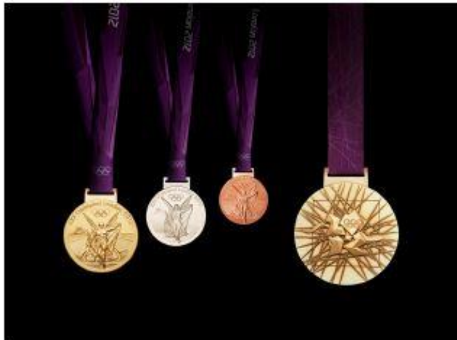
Imagen 6: Medallas olímpicas.