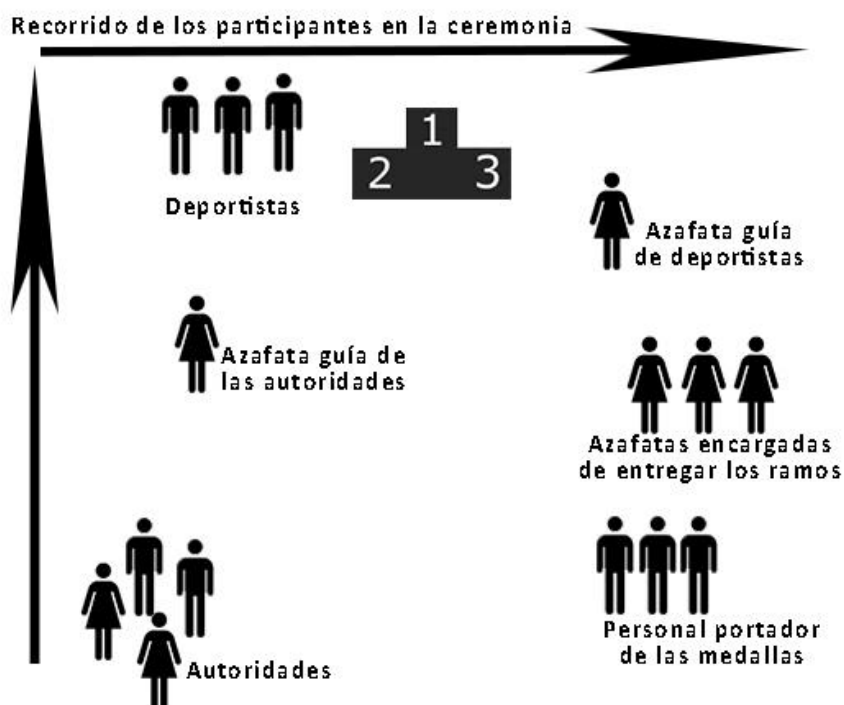
Esquema 3: Posiciones en la ceremonia de premiación.

Todos los participantes en la ceremonia de premiación estarán colocados de la siguiente manera.