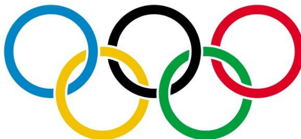
Imagen 1: Anillos Olímpicos.

Bandera Olímpica: es una bandera que tiene fondo blanco y el símbolo Olímpico a color. Los colores y las proporciones de la bandera deberán coincidir con el diseño de bandera que presentó Pierre de Coubertin en el Congreso de París de 1914 (J.M. López Guerrero, 2005:131).