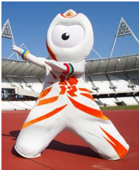
Imagen 4: Mascota Wenlock.

Para la edición de Londres 2012 se eligió una mascota a la que llamaron Wenlock y que reconocido por el creador de ésta, surgió de las gotas de acero sobrante de la construcción de una de las vigas del Estadio Olímpico. Fue diseñada por Michael Morpurgo de la agencia Iris.