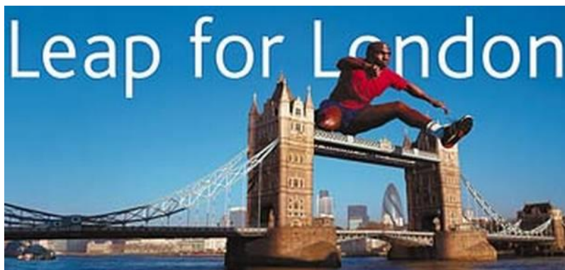
Imagen 7: Cartel de la campaña “Leap for London”

a “Make Britain Proud, Back the Bid” 7 para potenciar el nacionalismo británico. En esta campaña, también se realizó una acción de concienciación con los colores de Londres, “vistiendo “ de esos colores los lugares más emblemáticos, autobuses, taxis, billetes de tren, trenes, estaciones, metro, etc.