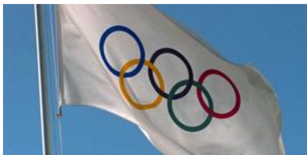
Imagen 2: Bandera Olímpica.

Emblemas olímpicos: es un diseño integrado que asocia los anillos olímpicos con otro elemento distintivo (Carta Olímpica 2004:18). Es un elemento que tiene que ser aprobado por la Comisión Ejecutiva del COI.