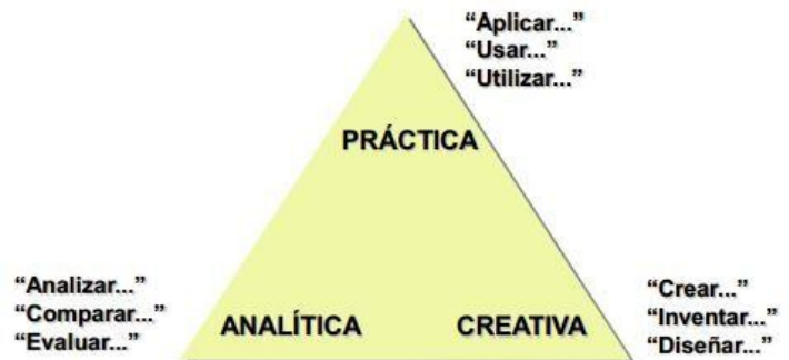
Figura II: Representación de la teoría triarquica

Sternberg iba en el mismo camino que Guilford y pensaba que era importante el procesamiento de la información. Porque cuando se resuelve un problema se utilizan varios aspectos de la inteligencia