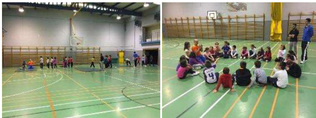
Foto 13: Pabellón polideportivo