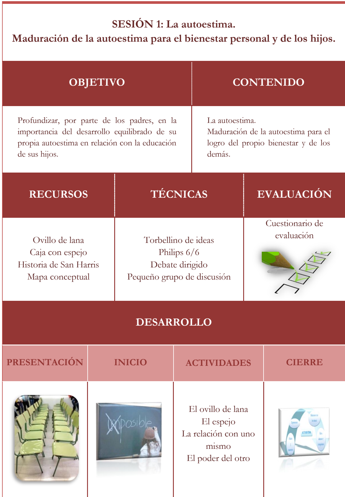
Tabla 4: Sesión 1 de la propuesta