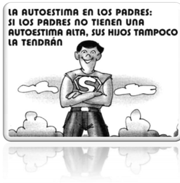
Figura 5: Influencia de los padres en la autoestima de los hijos

Seguidamente, recordaremos lo trabajado en la sesión anterior a través de una imagen con un mensaje sobre la influencia de los padres en la autoestima de sus hijos, comentando la importancia que tienen en su educación en todos los aspectos, como principales figuras de referencia que son para ellos.