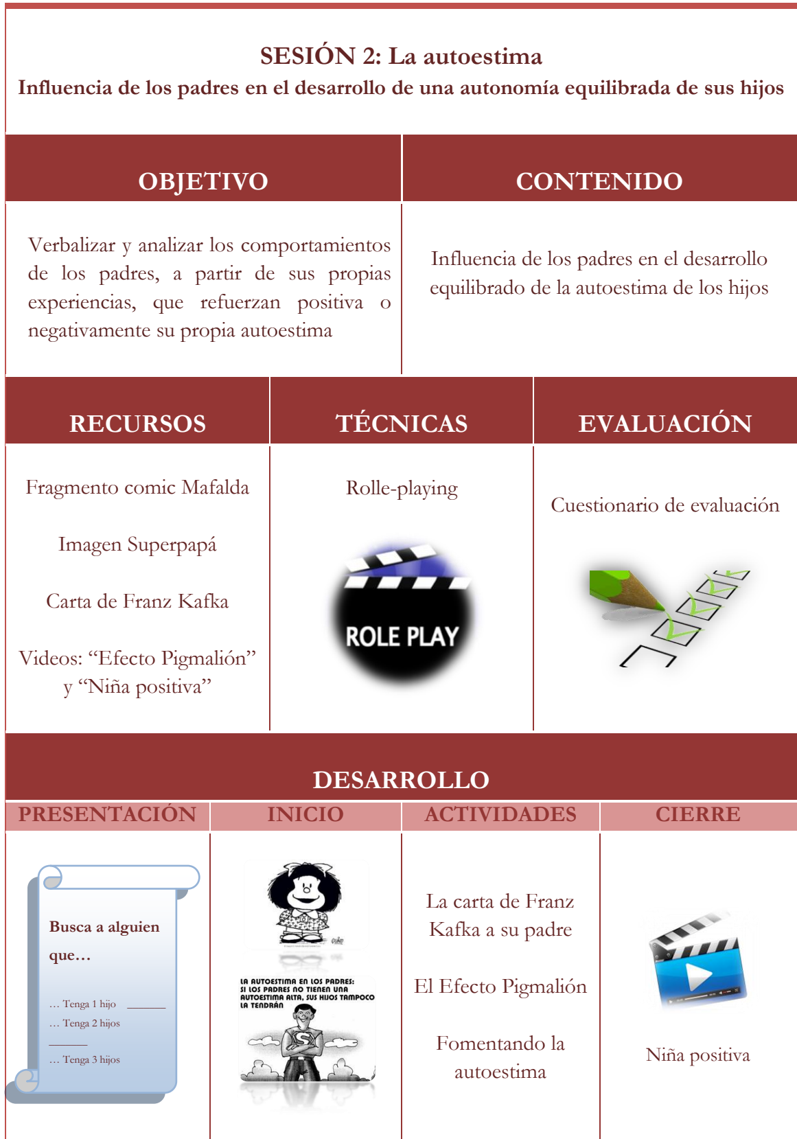
Tabla 5: Sesión 2 de la propuesta