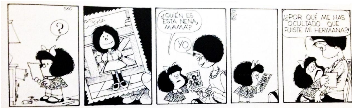
Figura 4: Fragmento comic Mafalda

Comenzaremos la segunda sesión con la presentación de un fragmento de comic de Mafalda, procurando captar la atención de las familias de forma amena desde el momento inicial, a través de dicha ilustración y de un breve comentario sobre la misma.